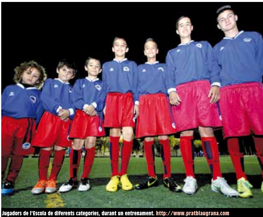
Jugadors de l'Escola de diferents categories, durant un entrenament. http://www.pratblaugrana.com

L'entitat, pionera en la formació de futbolistes a la nostra ciutat, tancarà ara el cicle amb un equip que començarà a competir la propera temporada a la 4a catalana