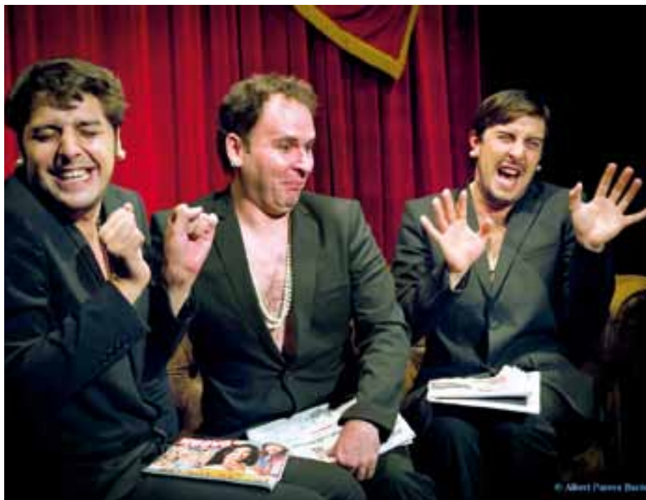
Imatges de dos dels espectacles que podrem veure: a dalt, L'Editto Bulgaro, i a sota, Oleanna.

La venda d'abonaments es farà entre divendres 18 i dissabte 19 de gener, a la taquilla del Teatre Modern, de 17 a 20 hores. I la venda anticipada d'entrades començarà el 21 de gener en els horaris propis de cada centre 🍷