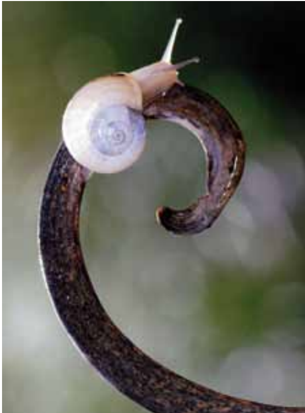
Primer premi Macrofotografia. Espiral , de Juan Antonio Díaz.