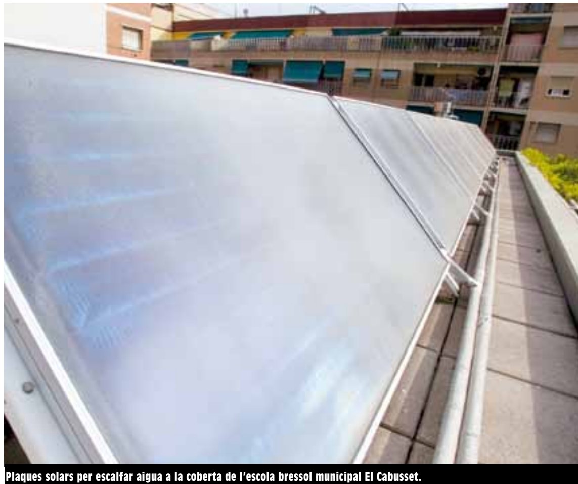
Plaques solars per escalfar aigua a la coberta de l'escola bressol municipal El Cabusset.

I Vehicles híbrids per a la Policia Local. La Policia Local farà servir properament 4 vehicles híbrids del model Prius de Toyota. És un pas més per renovar tota la flota municipal amb vehicles de baix consum.