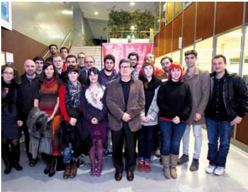
Els premiats i premiades, acompanyats per l'alcalde i regidors.

El premi en l'àmbit de comerç i turisme de 2012 va ser per a Catarus, Serveis