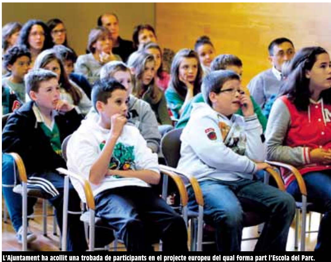
L'Ajuntament ha acollit una trobada de participants en el projecte europeu del qual forma part l'Escola del Parc.

A través del projecte Comenius, finançat per la Unió Europea, diverses escoles del continent, algunes de la nostra ciutat, treballen conjuntament projectes educatius