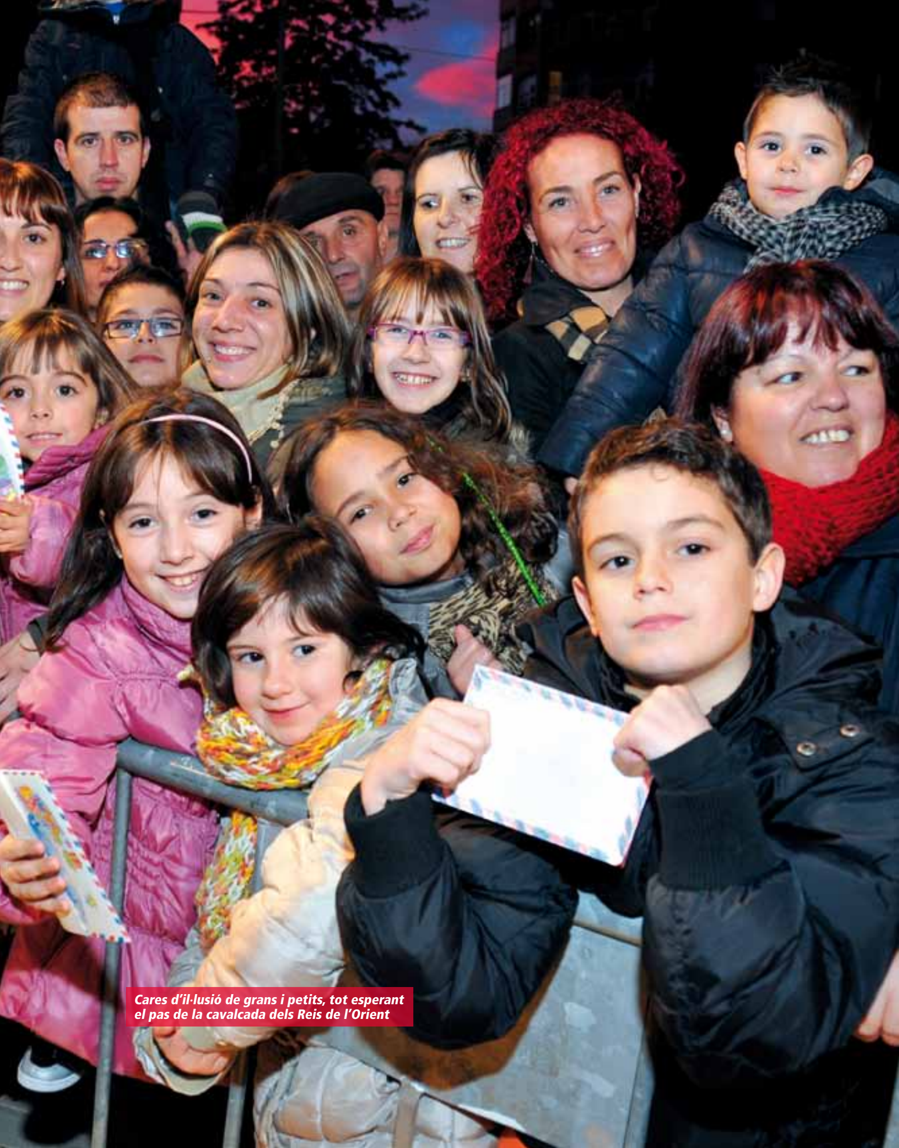
Cares d'il·lusió de grans i petits, tot esperant el pas de la cavalcada dels Reis de l'Orient