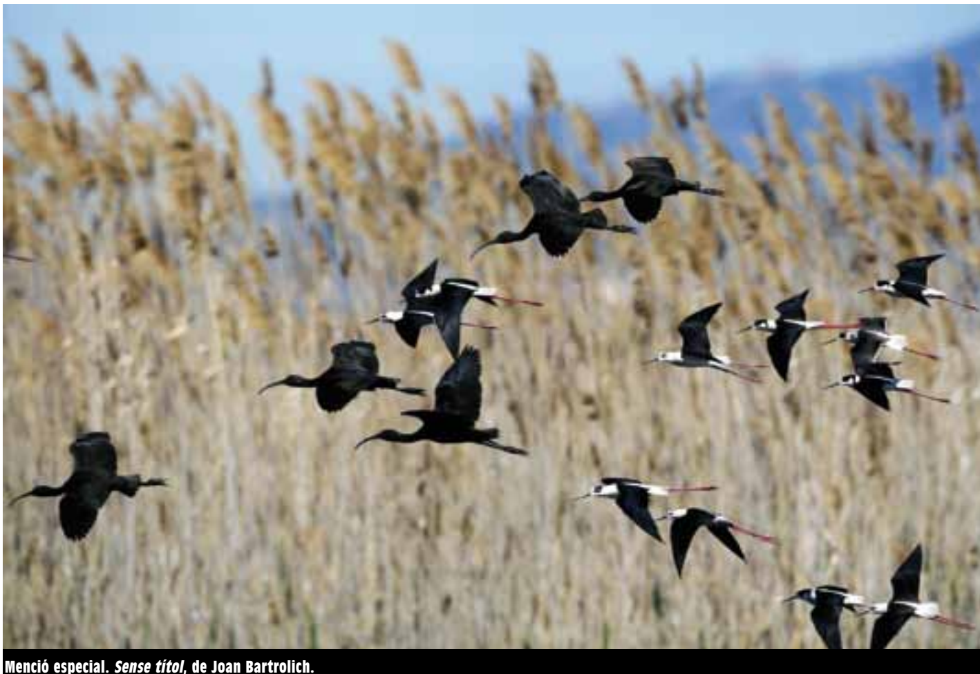
Menció especial. Sense títol , de Joan Bartrolich.