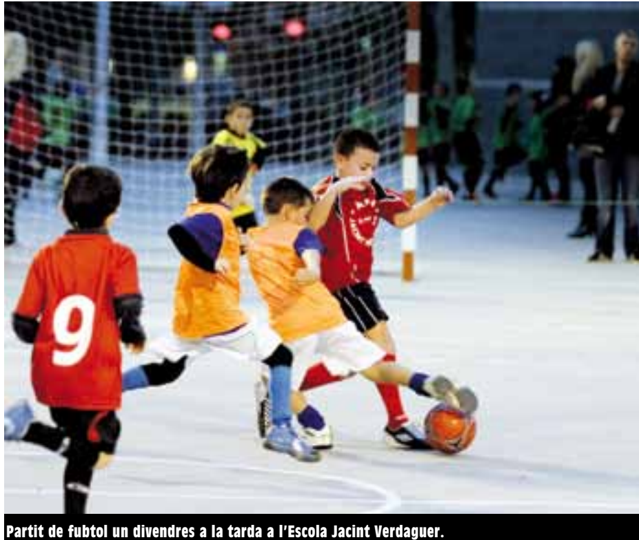
Partit de futbol un divendres a la tarda a l'Escola Jacint Verdaguer.

Amb l'impuls de l'Ajuntament i de les AMPA, s'estan multiplicant per la ciutat els equips esportius formats per alumnes de les escoles