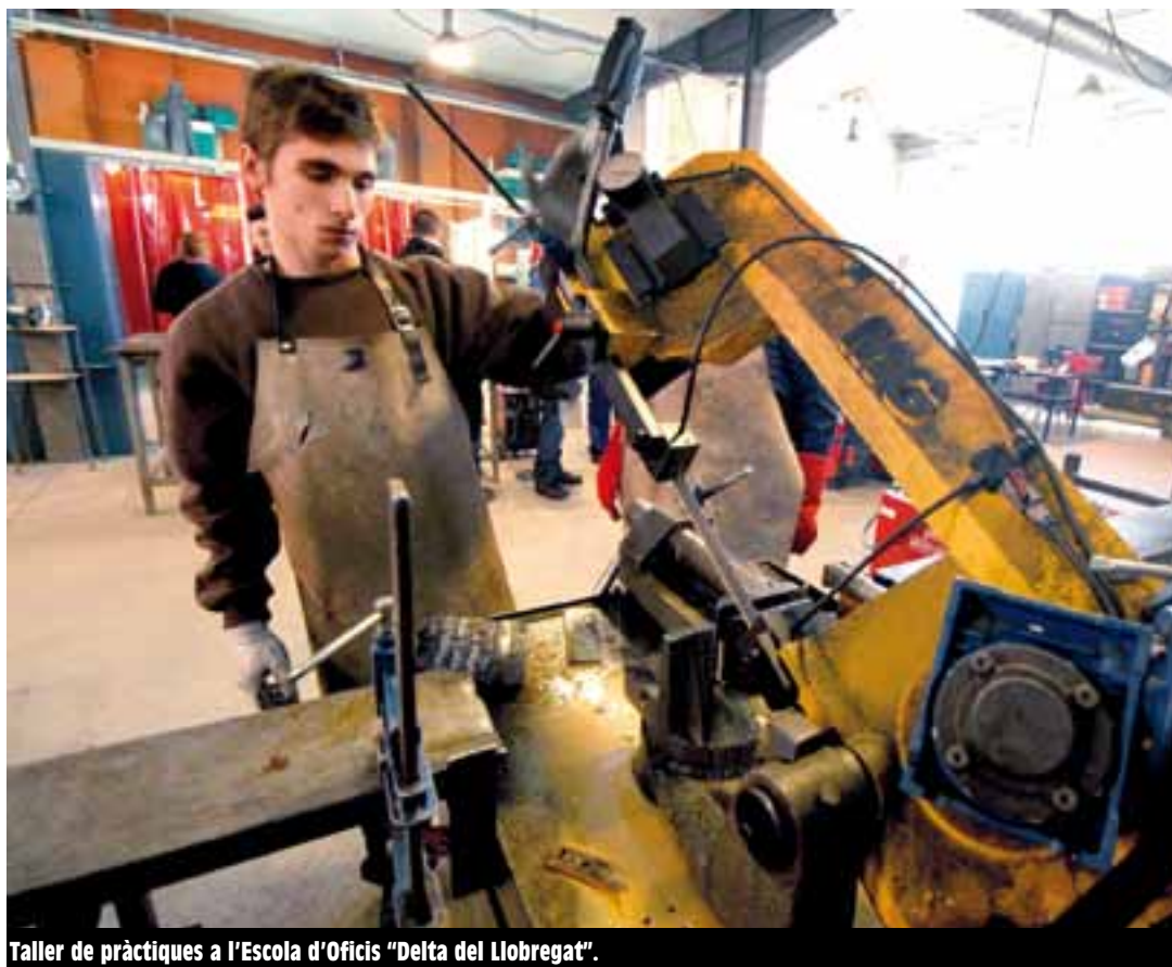
Taller de pràctiques a l'Escola d'Oficis "Delta del Llobregat".

L'Institut Illa dels Banyols acull una nova especialitat del Pla de Transició al Treball (PTT): auxiliar en reparació i manteniment de vehicles lleugers