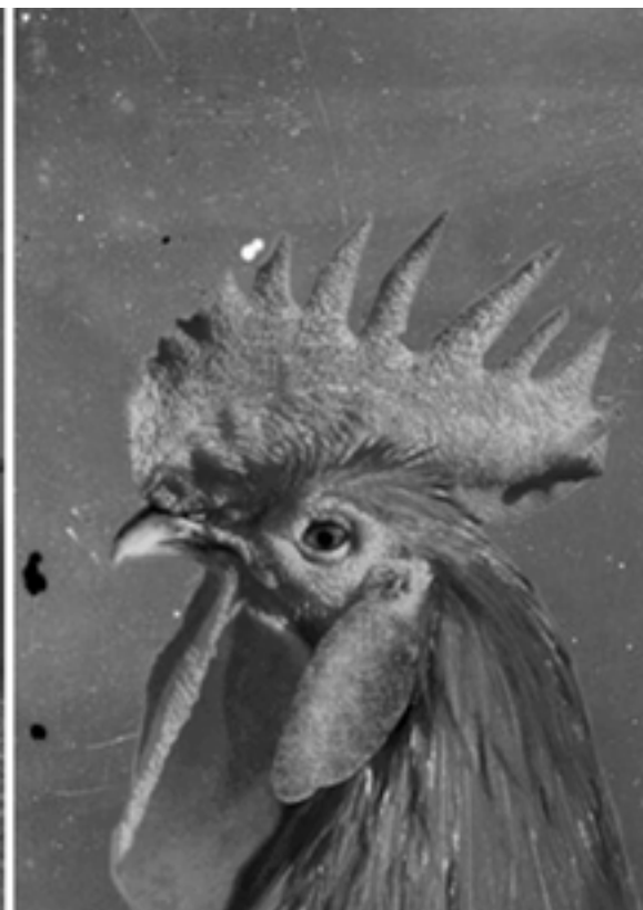
Autor: Gabriel Guerrero. http://www.torremuntadas.elprat.cat

ta un neó que forma part d'un ampli projecte ("L'efecte Barnum") que desenvolupa arreu del món.