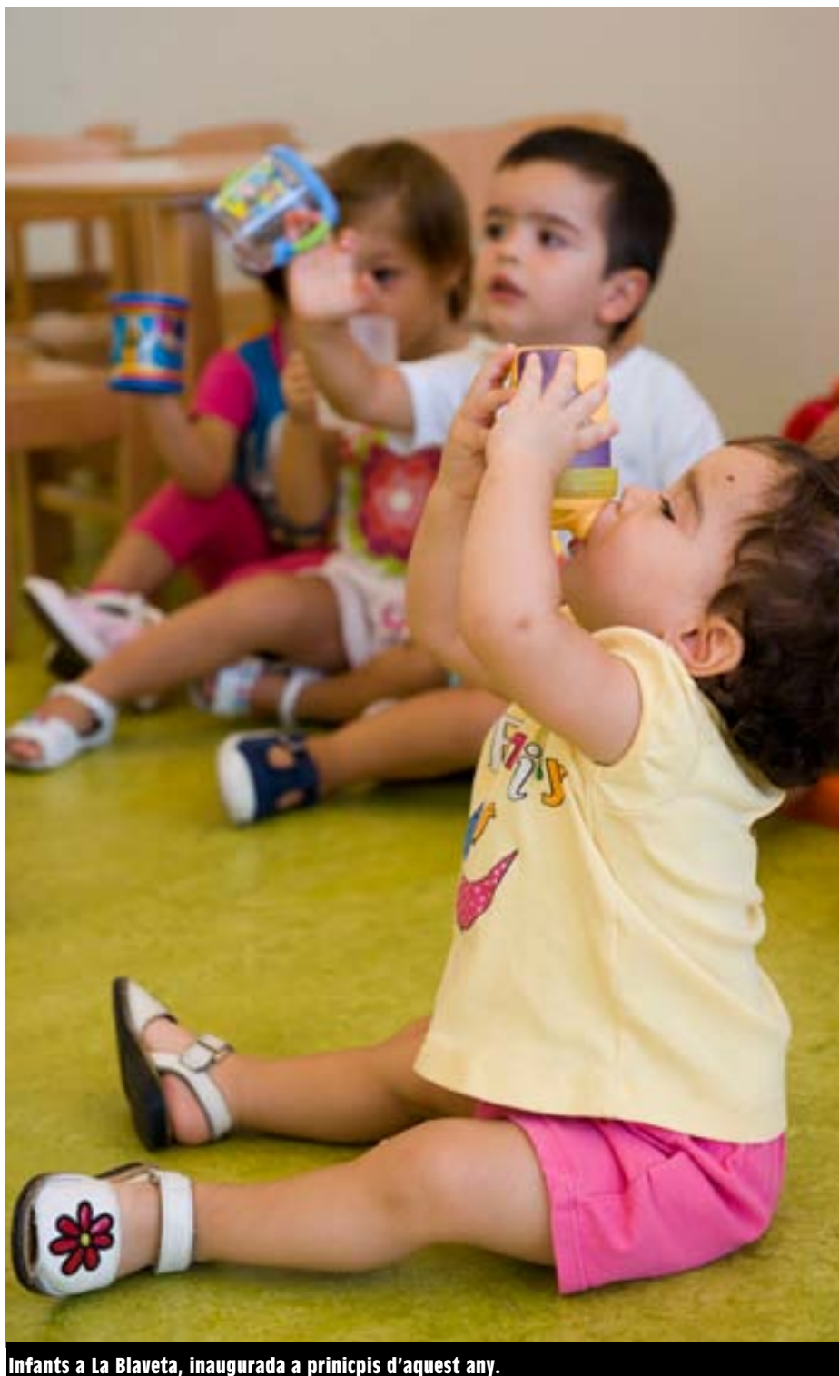
Infants a La Blaveta, inaugurada a principis d'aquest any.

La Regidoria d'Educació fomenta la participació, amb nombroses accions de suport a les Ampa, famílies i altres membres de la comunitat educativa. Entre les activitats que es desenvoluparan destaquen sessions de formació a través del programa PRATfamílies, sobre temes tant diversos com el joc, l'alimentació, la televisió o com afrontar els canvis i les pèrdues en l'entorn familiar.