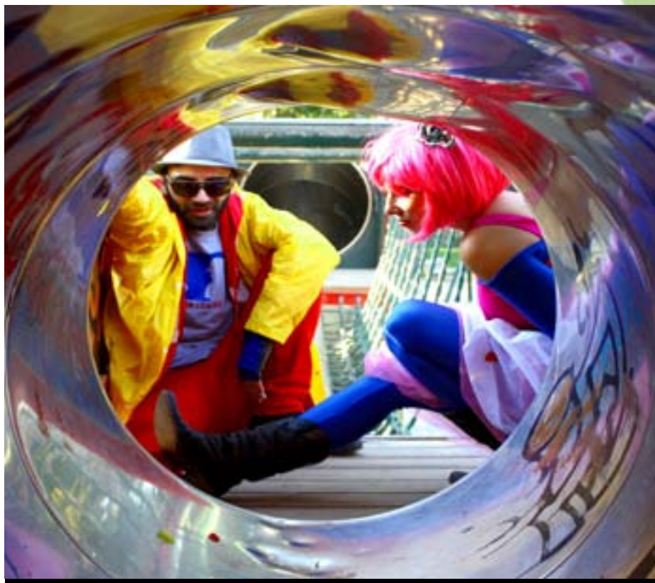
Vie Vide, un dels grups locals que actuaran dins el cycle 08820 de música feta al Prat.

Tota la informació detallada a www.elprat.cat , www.lacapsa.org i www.centric.elprat.cat