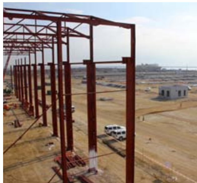
Aspecte de les obres de la nova terminal portuària.

Durant la visita, l'alcalde del Prat va criticar el retard en les obres de connexió viària i ferroviària del port, un fet "incomprensible" i un "gravíssim error", i en va culpar fonamentalment els diferents governs estatals.