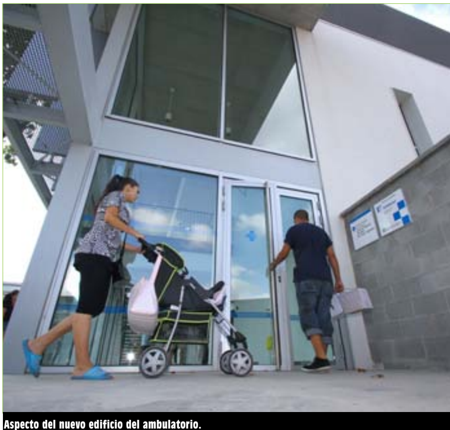
Aspecto del nuevo edificio del ambulatorio.