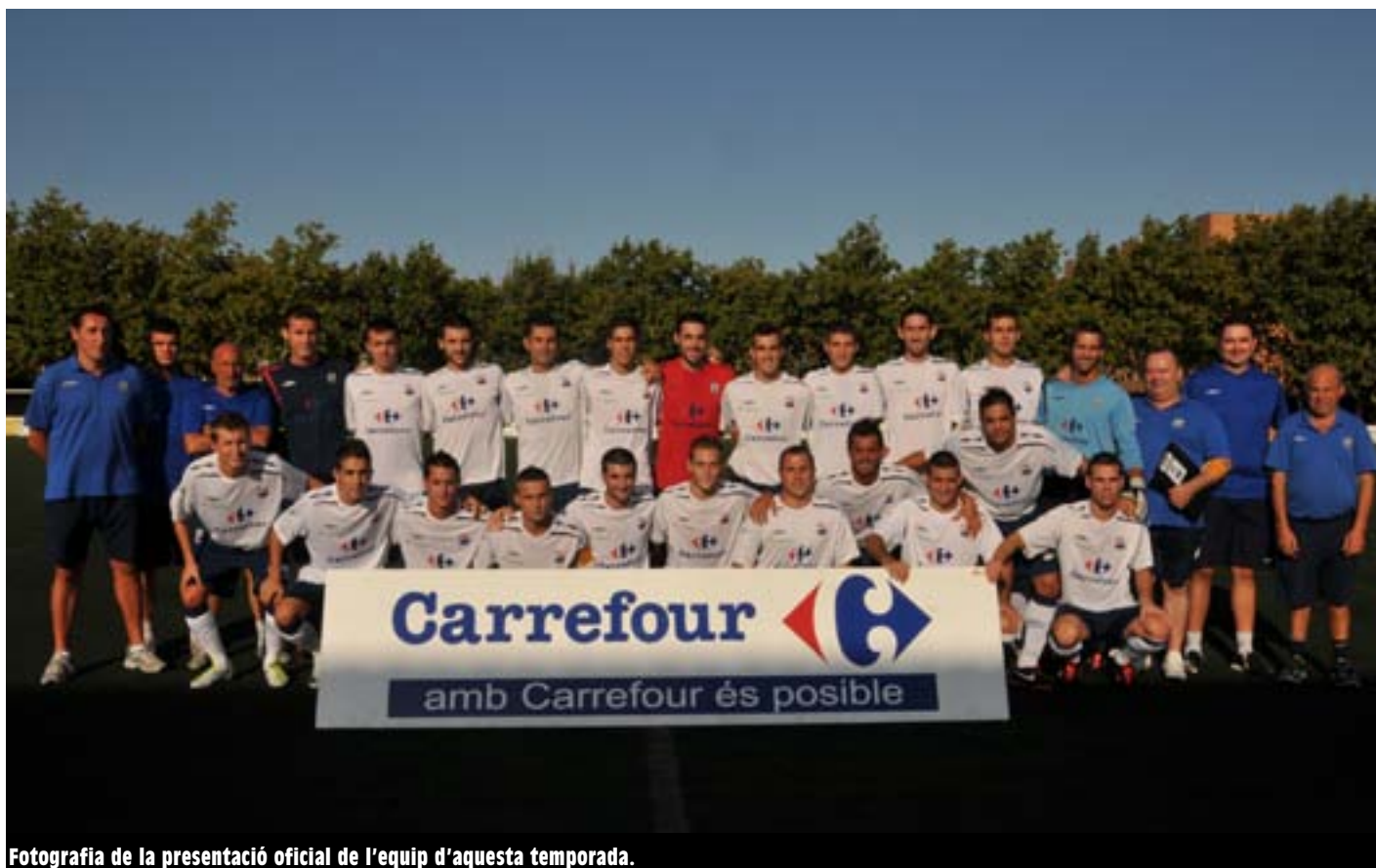
Fotografia de la presentació oficial de l'equip d'aquesta temporada.