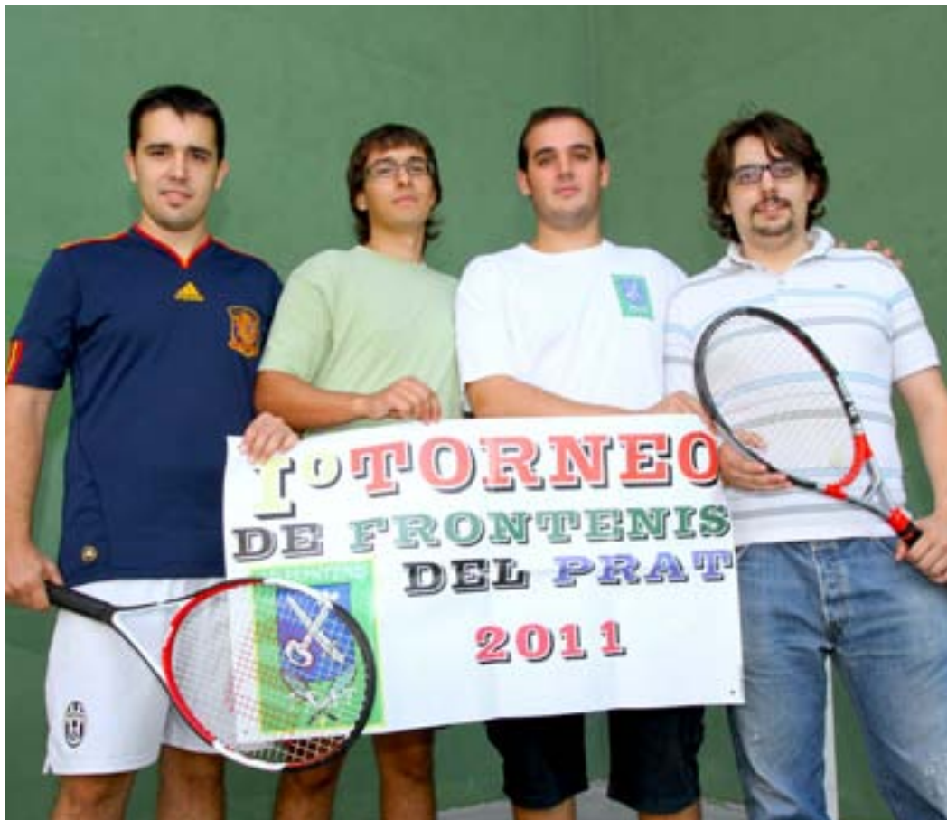
Quatre dels membres de l'associació, al frontó del CEM Estruch.