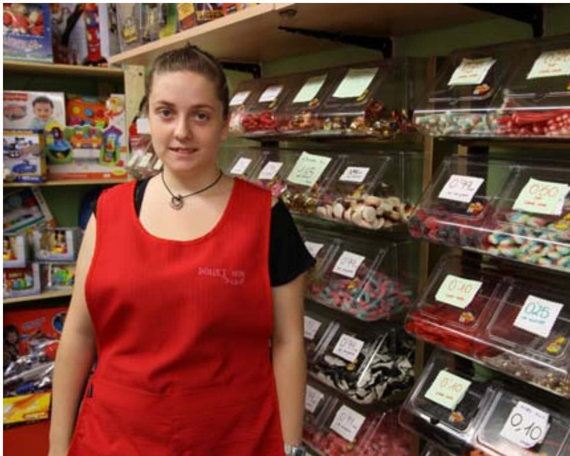
Alumna del programa Suma't trabajando en la tienda Dolçet Nor.

El CPE ha realizado una campaña de difusión para dar a conocer a las em-