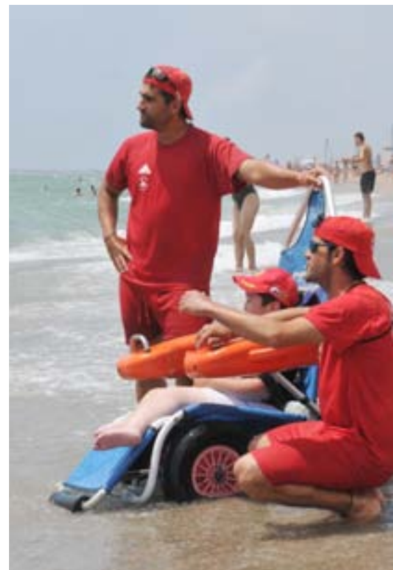
Servei de bany adaptat.

Aquest estiu , fins al 31 d'agost, han fet 39 serveis amb la cadira am-