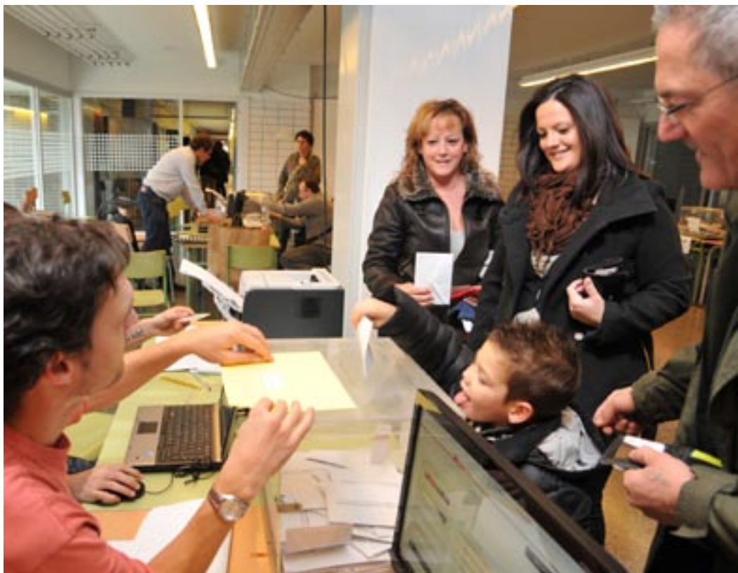
La participació va ser més d'un 4,5% superior a la de quatre anys enrere.

La segona força més votada al Prat va ser el PSC, amb el 26,28% i 6.651 vots (37,88% i 8.955 vots l'any 2006); seguida del PP, amb un 14,89% i 3.769 vots (13% i 3.075 vots l'any 2006); ICV-EUiA, amb un 11,78% i 2.983 vots (12,12% i 2.866 l'any 2006); ERC, amb un 4,67% i 1.182 vots (8,7% i 2.055 vots l'any 2006); i C's,