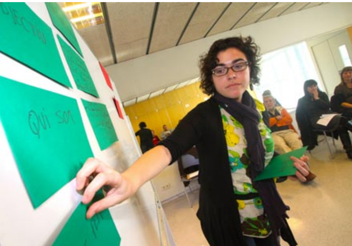
Imatge d'un dels tallers participatius celebrats durant les jornades.