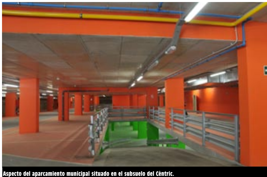
Aspecto del aparcamiento municipal situado en el subsuelo del Cèntric.

Prat Espais prevé que el aparcamiento entre en funcionamiento durante el primer trimestre de 2011. Aunque se destinará fundamentalmente a clientes y clientas con abono, una parte se dedicará a plazas de rotación. Las opciones de comercialización serán en régimen de cesión de uso por 50 años (compra) y ce-