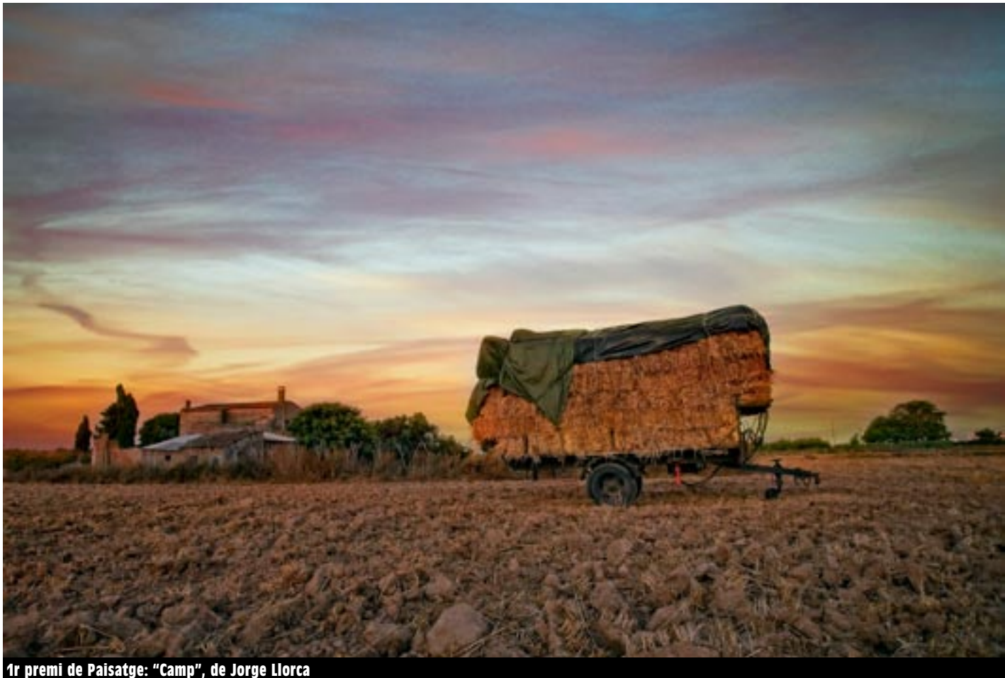
1r premi de Paisatge: "Camp", de Jorge Llorca