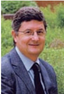
Lluís Tejedor L'alcalde

El Cèntric és l'equipament més modern i ambiciós de la ciutat; per això, l'equip de govern hi ha apostat fort, convençut que ha de representar una veritable palanca perquè el Prat faci un salt ben alt, socialment i culturalment. Aquest projecte és també el resultat d'un magnífic treball en equip de bons professionals de moltes disciplines que han donat el millor del seu coneixement i creativitat. El Cèntric, ara ja és vostre; cuideu-lo entre tots i totes, i gaudiu-ne amb felicitat.