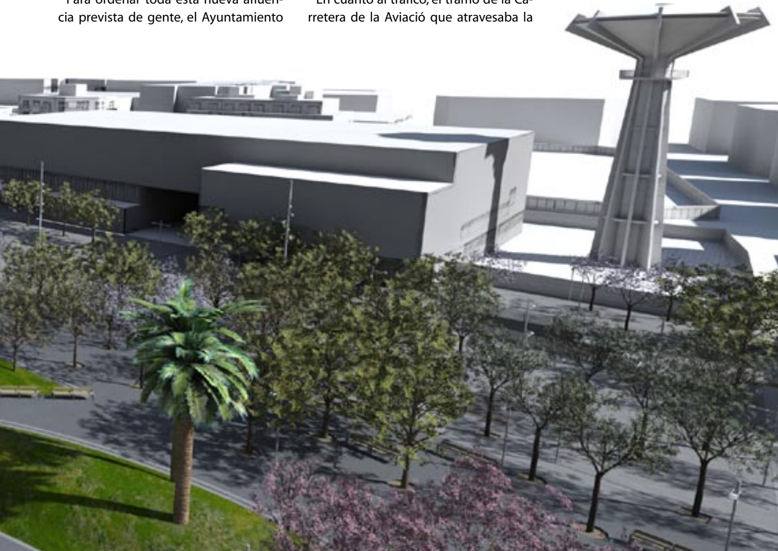
Imagen de ordenador que muestra cómo quedará en un futuro la pl. de Catalunya con la nueva urbanización.

plaza y que lleva años cortado por las obras será exclusivo para peatones, ya que los estudios de movilidad así lo han aconsejado. La nueva ordenación de la plaza también supondrá la eliminación de algunas plazas de aparcamiento en superficie, compensadas por la oferta del nuevo parking subterráneo 🚗👉