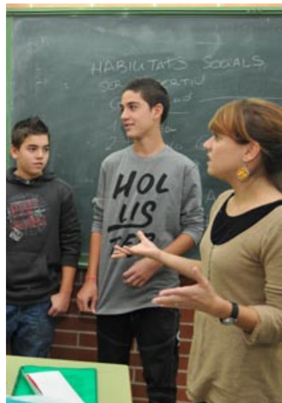
Una sessió de treball a l'Institut Baldiri Guilera.

I Les activitats es despleguen en quatre línies: Desenvolupament personal, Prevenció de conductes addictives, Alimentació saludable i Afectivitat i sexualitat. Tenen una gran acceptació per part dels centres de secundària i