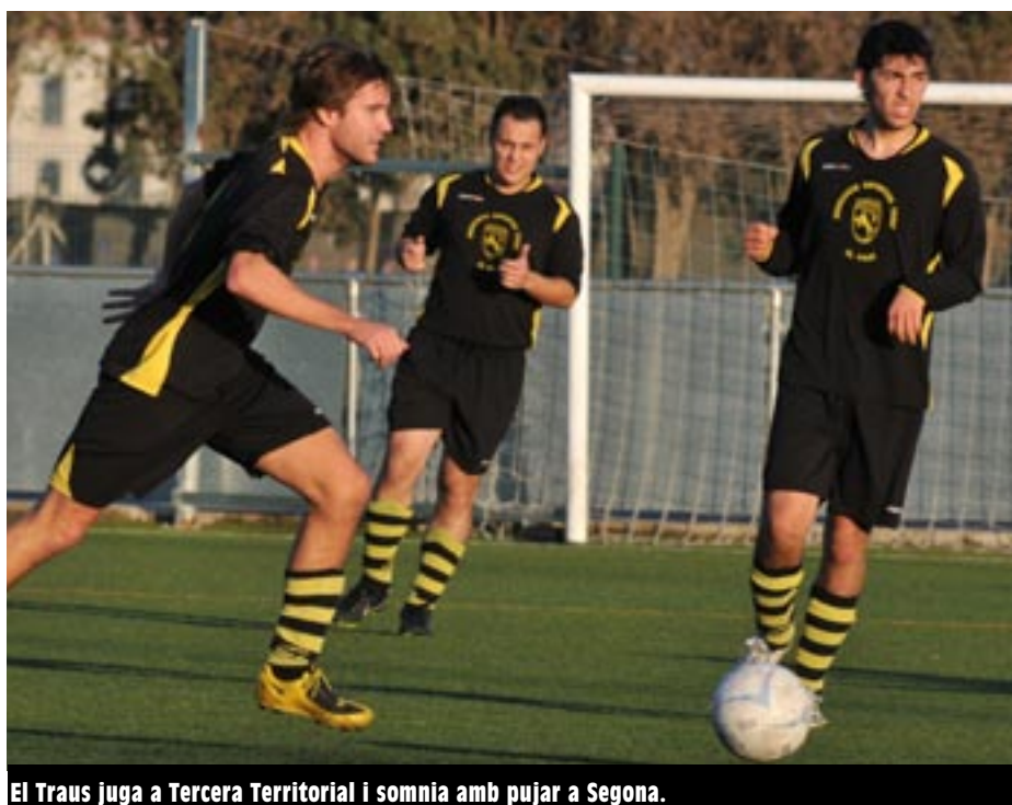
El Traus juga a Tercera Territorial i somnia amb pujar a Segona.