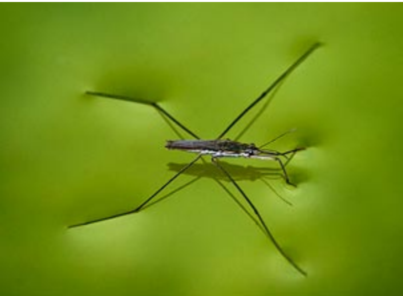
1r premi de Macrofotografia: "Sobre el agua", de Luis Leandro Serrano