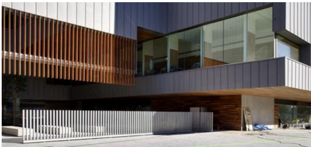
La arquitectura de vanguardia del Cèntric aporta calidad y singularidad a la pl. de Catalunya.