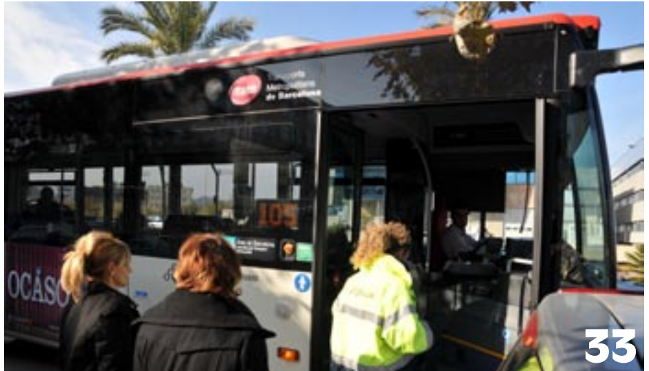
L'autobús 105 modifica el seu recorregut per passar pel Mas Blau II.