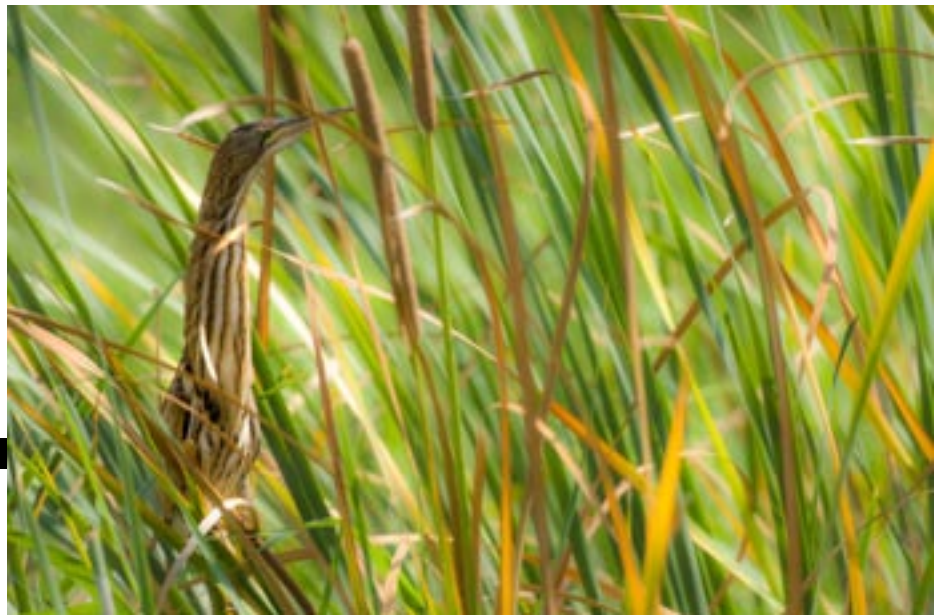
1r premi Caça fotogràfica: "Camuflatge", de Joan Guillamat