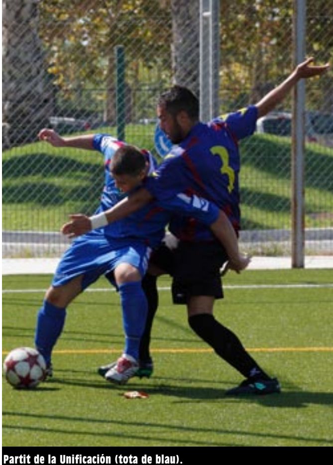
Partit de la Unificación (tota de blau).