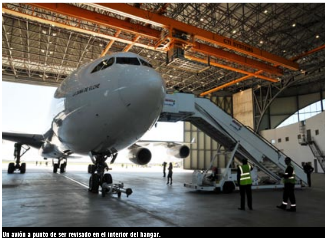
Un avión a punto de ser revisado en el interior del hangar.

La instalación, que ha ido entrando en funcionamiento de manera progresiva, será un revitalizador de la economía de la zona y más concretamente de El Prat