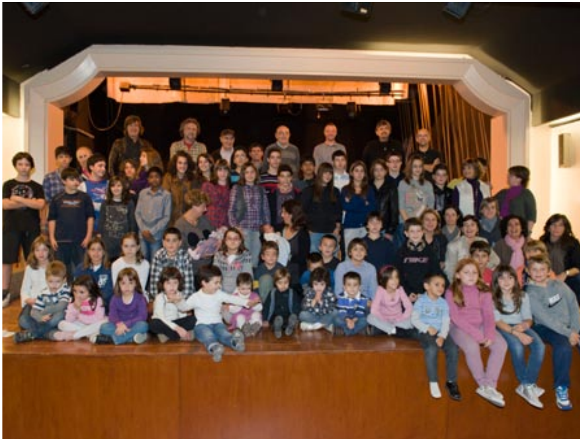
Membres de l'associació en el descans d'un assaig, a l'auditori de Torre Balcells.