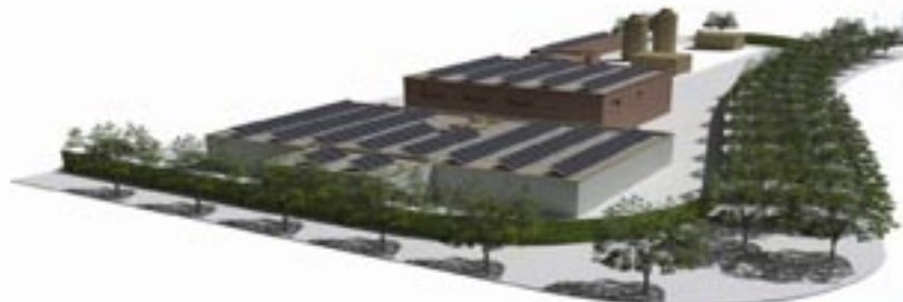
Projecte ETAP SAGNIER

Més informació sobre aquesta i altres novetats a la nostra web: www.aiguesdelprat.cat