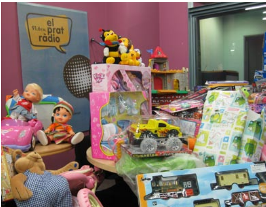
Imagen de la recogida de juguetes del año pasado.