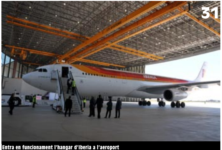
Entra en funcionament l'hangar d'Iberia a l'aeroport