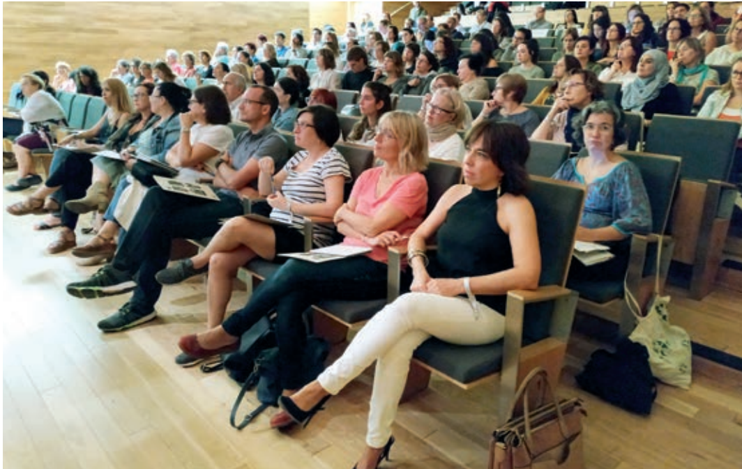
Público asistente a la jornada, celebrada en el auditorio del Cèntric.

El Ayuntamiento organiza una jornada sobre el papel que puede jugar la comunidad en la salud emocional de las personas que sufren alguna pérdida traumática