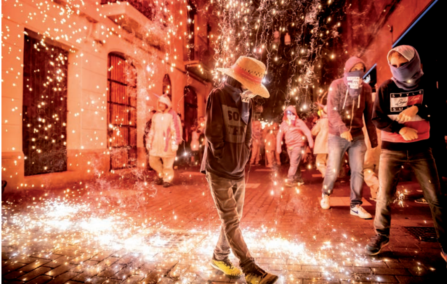
El Pratífoc al seu pas pel c. de Ferran Puig, al costat de la pl. de la Vila.