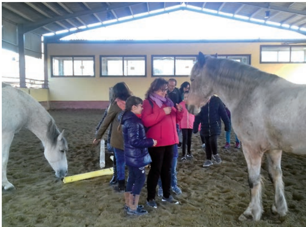
Un grupo de personas participa en una sesión de equinoterapia.

Lo más importante del trabajo grupal es, sin embargo, el hecho de que permite sentirse miembro de un conjunto de personas (familias, madres, padres, hijos e hijas...) que se encuentran semanalmente en alguno de los espacios propuestos, potencian sus relaciones,