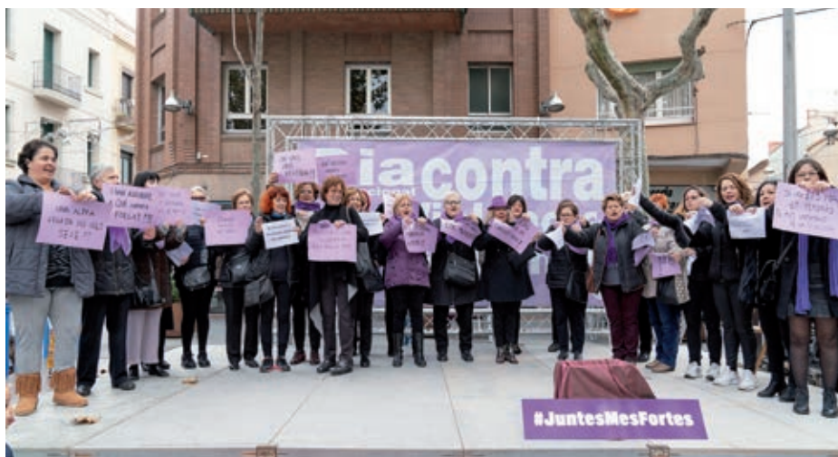
Activitat del 25N de l'any passat a la pl. de la Vila.

El Ayuntamiento de El Prat ha renovado su compromiso con "Bienvenidas, refugiadas", un proyecto para apoyar la acogida e inclusión en nuestra ciudad de personas refugiadas en situación de vulnerabilidad. El proyecto lleva nueve meses en El Prat y ha apoyado a más de 40 familias.