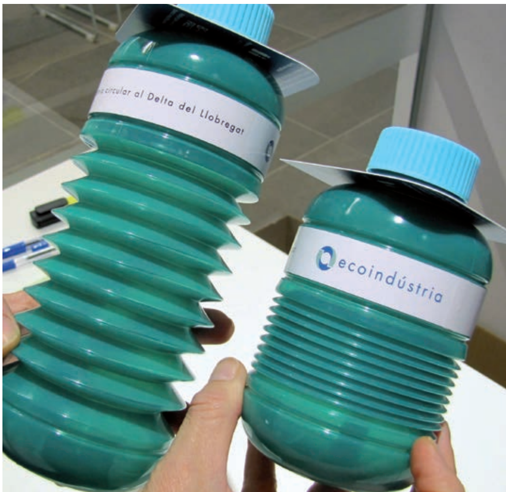
Botellas fabricadas para la jornada de economía circular de Ecoindústria, en el delta del Llobregat, elaboradas con material 100 % reciclable, sin tóxicos y reutilizables.

Asimismo, las empresas de nuestro municipio pueden optar a los programas de la Agència per a la Innovació i el Coneixement del Baix Llobregat —Acceleradora Empresarial, programas de capacitación o ciclos de transmisión de conocimientos— para identificar oportunidades y riesgos de las nuevas tecnologías (más información en www.innobaix.cat ).