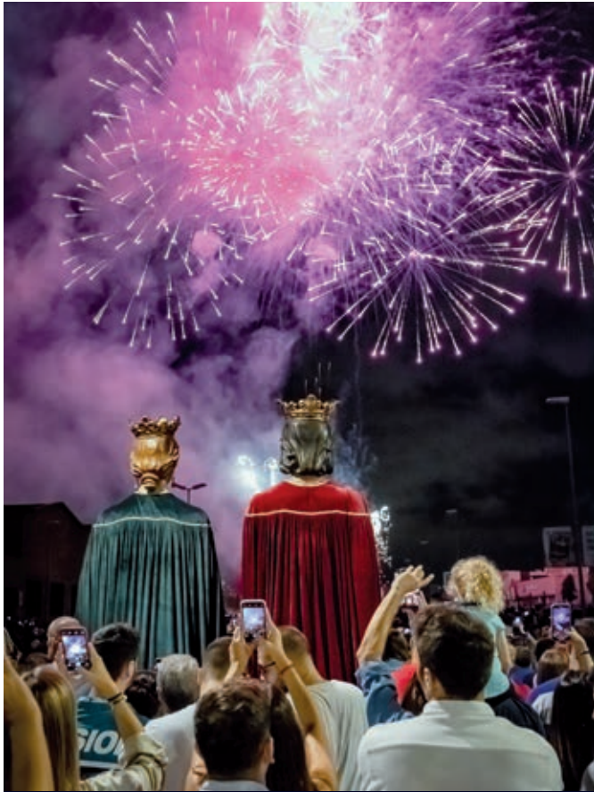
Espectacle piromusical de final de festa.