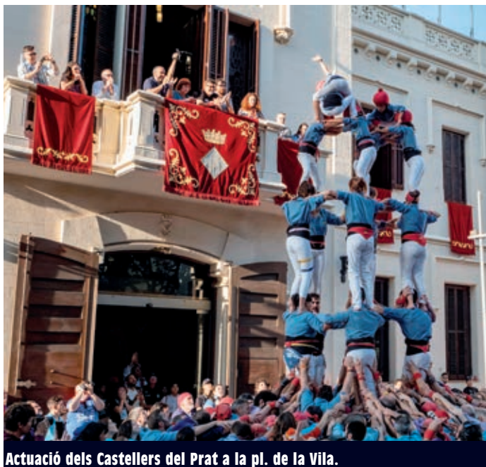
Actuació dels Castellers del Prat a la pl. de la Vila.