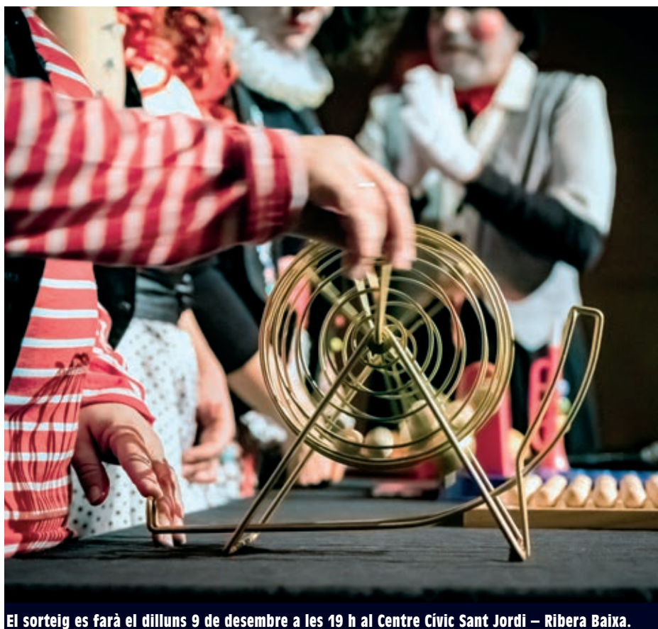
El sorteig es farà el dilluns 9 de desembre a les 19 h al Centre Cívic Sant Jordi – Ribera Baixa.