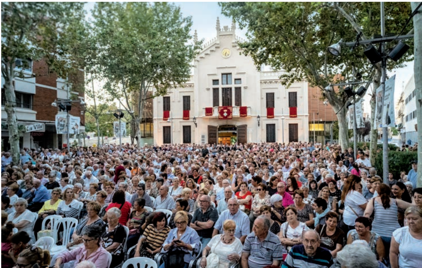
El concert de Mocedades va omplir la pl. de la Vila de gom a gom.