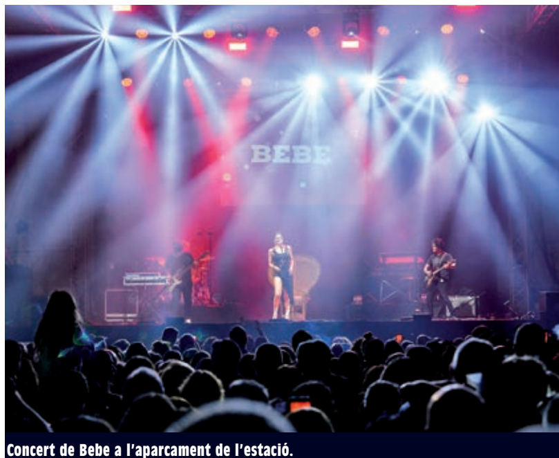
Concert de Bebe a l'aparcament de l'estació.

La Festa Major del 2019 va comptar amb més de 130 actes; més de la meitat, organitzats per entitats i grups locals. Entre els que van tenir més participació ciutadana figuren els de cultura popular i tradicional (toc d'inici i esclat de Festa Major, trobada casteller, Pratífoc, trobada gegantera...), els concerts (les Nits a l'Estació, amb Bebe i Toreros Muertos, que van aplegar unes 16.000 persones, i Mocedades a la pl. de la Vila amb 1.500 assistents), El Prat Nocturn (amb 1.495 participants), la diada casteller, la paella per a la gent gran, etc. Enguany, el pregó va ser especial, ja que va ser coral, a càrrec de l'Institut Baldiri Guiler. I no acabaríem d'explicar coses. Per això us recomanem que mireu els vídeos publicats a l'apartat "Festa Major" d' elprat.tv 🐦