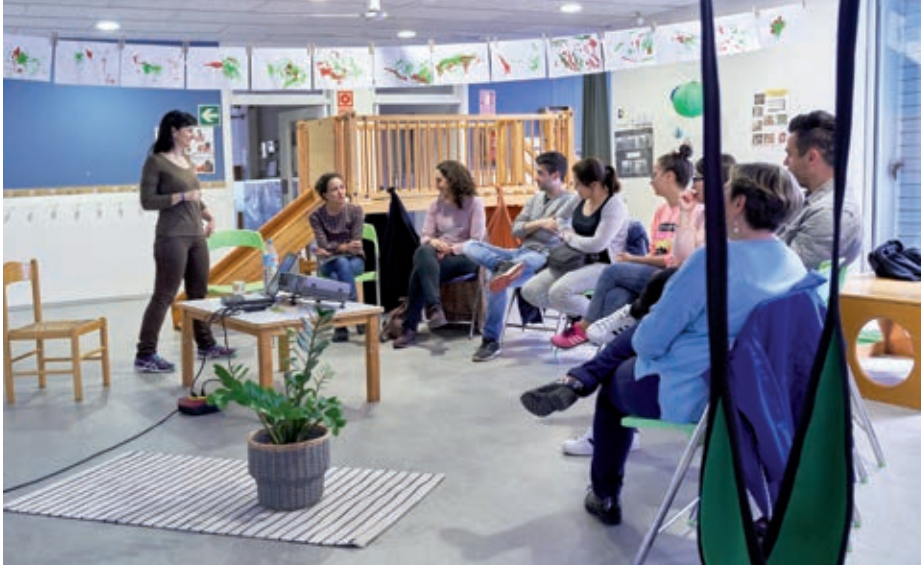
Un dels tallers del curs passat en una escola bressol municipal de la ciutat.