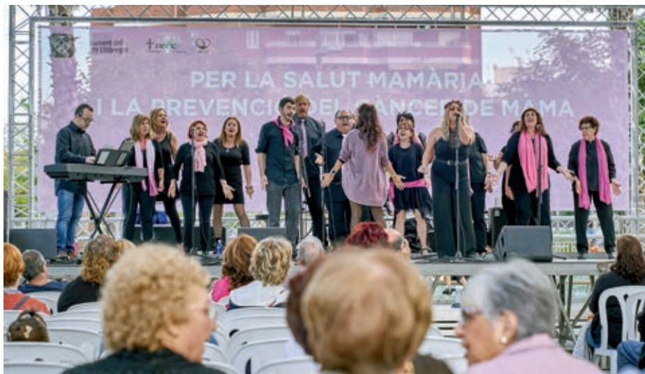
Una de les activitats sobre salut mamària celebrades aquest mes d'octubre.

Segons la darrera actualització del dossier de població, amb data 12 de març del 2019, al Prat hi ha 64.674 persones empadronades, de les quals 33.017 són dones i 31.657, homes. Respecte de l'any passat, s'ha produït un increment de 490 habitants. Destaca la gran estabilitat de la població del Prat, que des del 1990 es manté pràcticament estable.