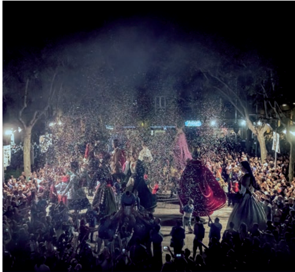
Esclat de Festa Major.