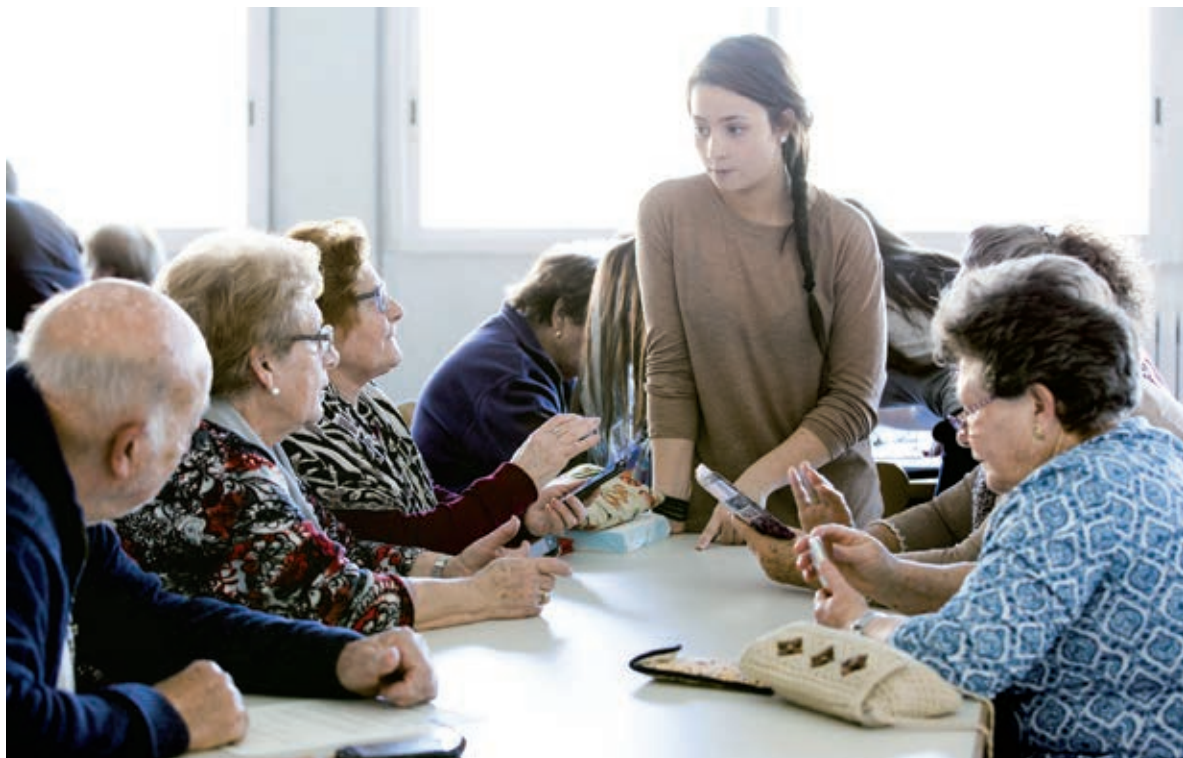
Una alumna d'institut participa en el projecte Connecta Jove, en què nois i noies ensenyen a persones grans a utilitzar telèfons mòbils i altres dispositius digitals.

Generalitat, conjuntament amb el departament municipal d'Educació, ha elaborat un catàleg amb tots els projectes disponibles, que aquest curs són 30 al Prat.