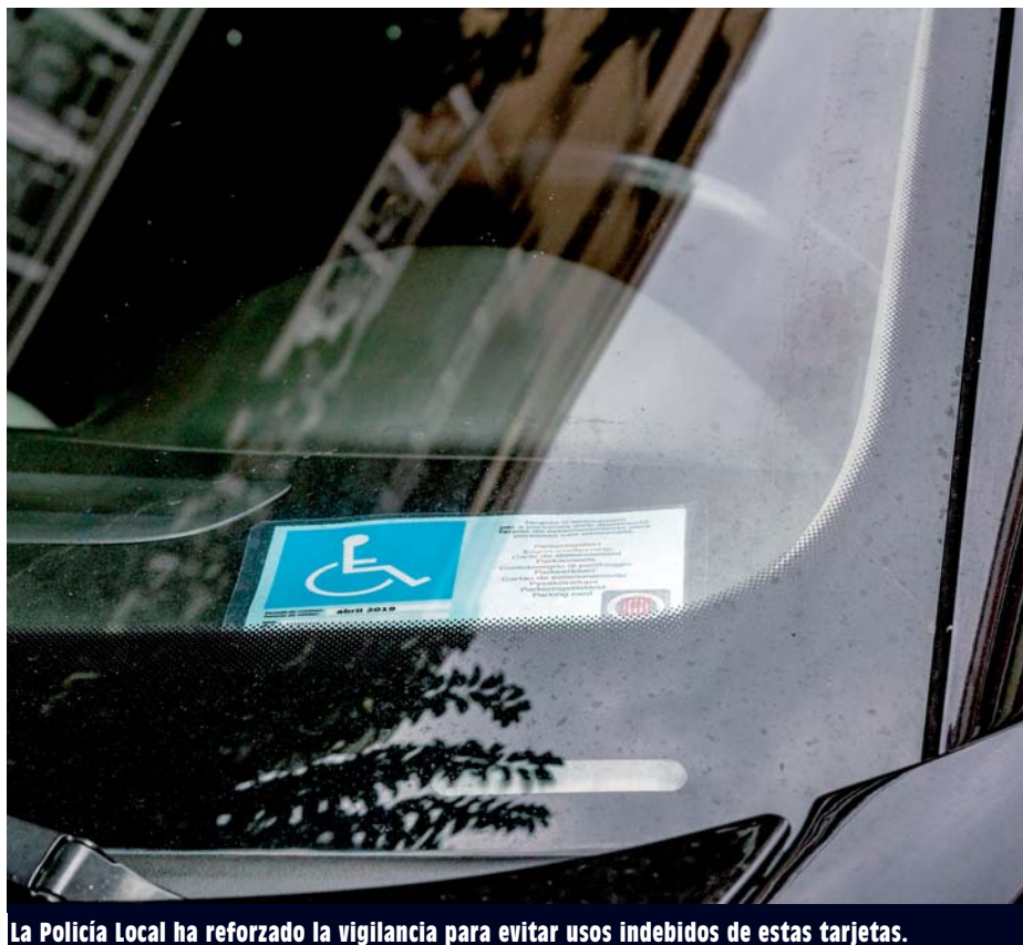
La Policía Local ha reforzado la vigilancia para evitar usos indebidos de estas tarjetas.

A parte de los usos indebidos más habituales, como usar la tarjeta sin ser su titular, se han detectado fotocopias en color de tarjetas originales, tarjetas de personas fallecidas e incluso falsificaciones de los documentos que permiten obtenerlas. Estas tarjetas sirven para facilitar la circulación, la autonomía y la integración social y profesional de personas con discapacidad o movilidad reducida, ya que permiten a sus titulares