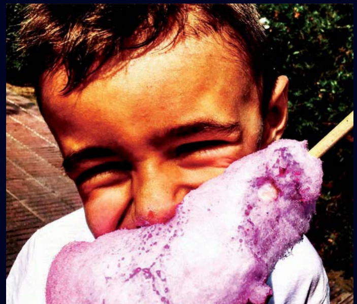
Premi Clic Prat mòbil: @64sergipejoan.