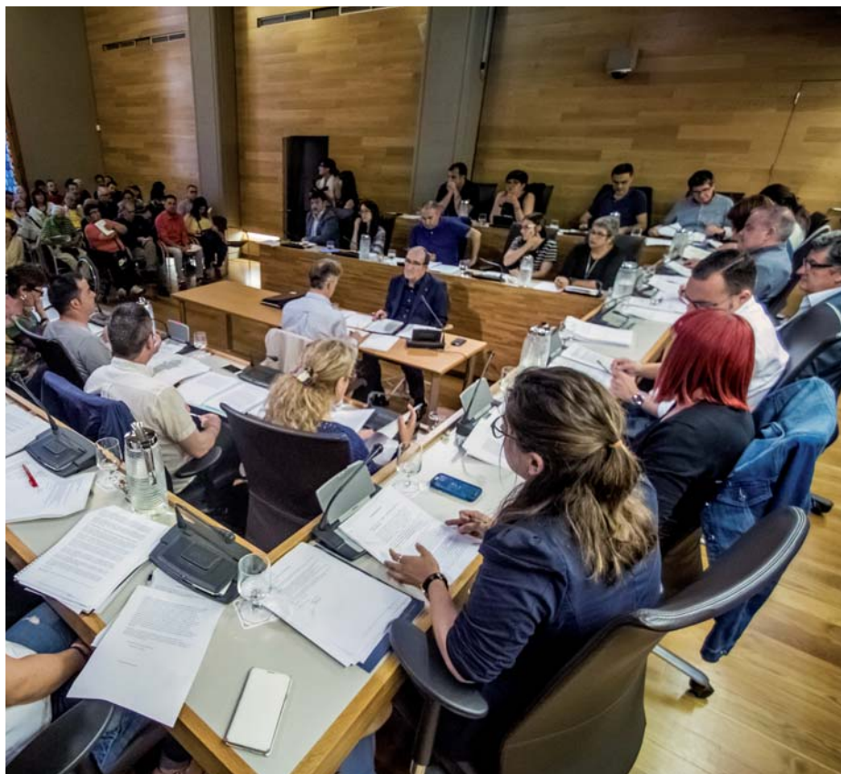
Las ordenanzas fiscales se aprueban en el Pleno Municipal del Ayuntamiento.

Como respuesta a los efectos de la crisis económica, las ordenanzas fiscales municipales para el año 2017 contemplarán diversas medidas sociales y de impulso de la economía local: