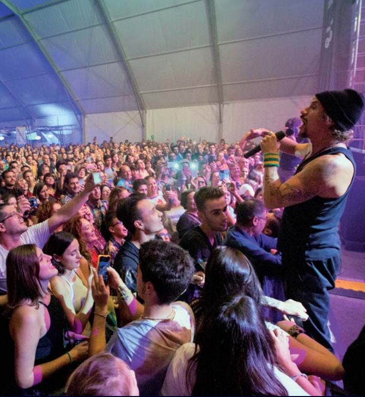
Multitudinari concert de Macaco al pàrquing de l'estació, amb més de 15.000 persones.