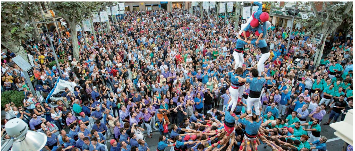
Vam viure una emocionant jornada castellera amb tres castells de nou descarregats i una plaça de la Vila plena de gom a gom.