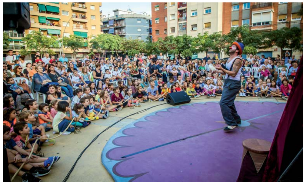
Els més petits han gaudit dels diferents espectacles infantils.