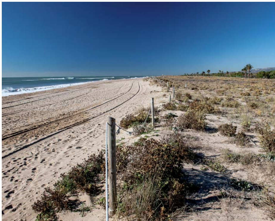
L'ascens del nivell del mar és un dels principals riscos del canvi climàtic per al Prat.

També caldrà parar especial atenció als efectes de l'augment de la temperatura sobre la salut de les persones (onades de calor, afeccions respiratòries) i sobre la biodiversitat (alteracions dels ecosistemes litorals, espècies exòtiques invasores, etc).