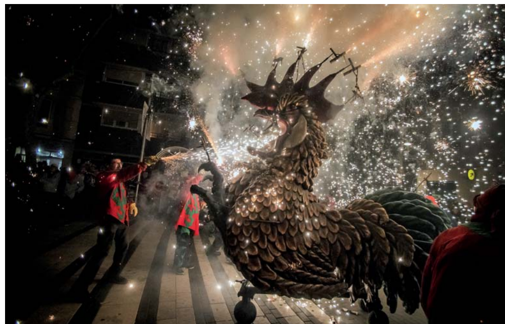
El Pollo ha celebrat el seu 25è aniversari durant aquesta Festa Major.