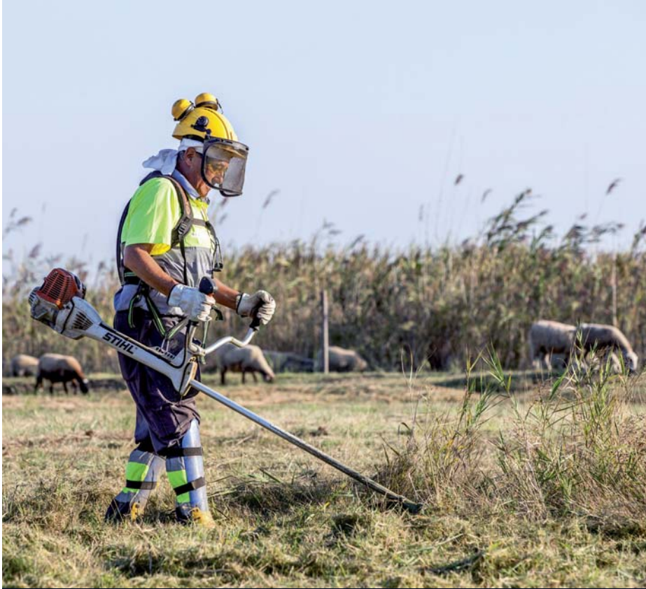
Una de les persones contractades fent una tasca de control de la vegetació.