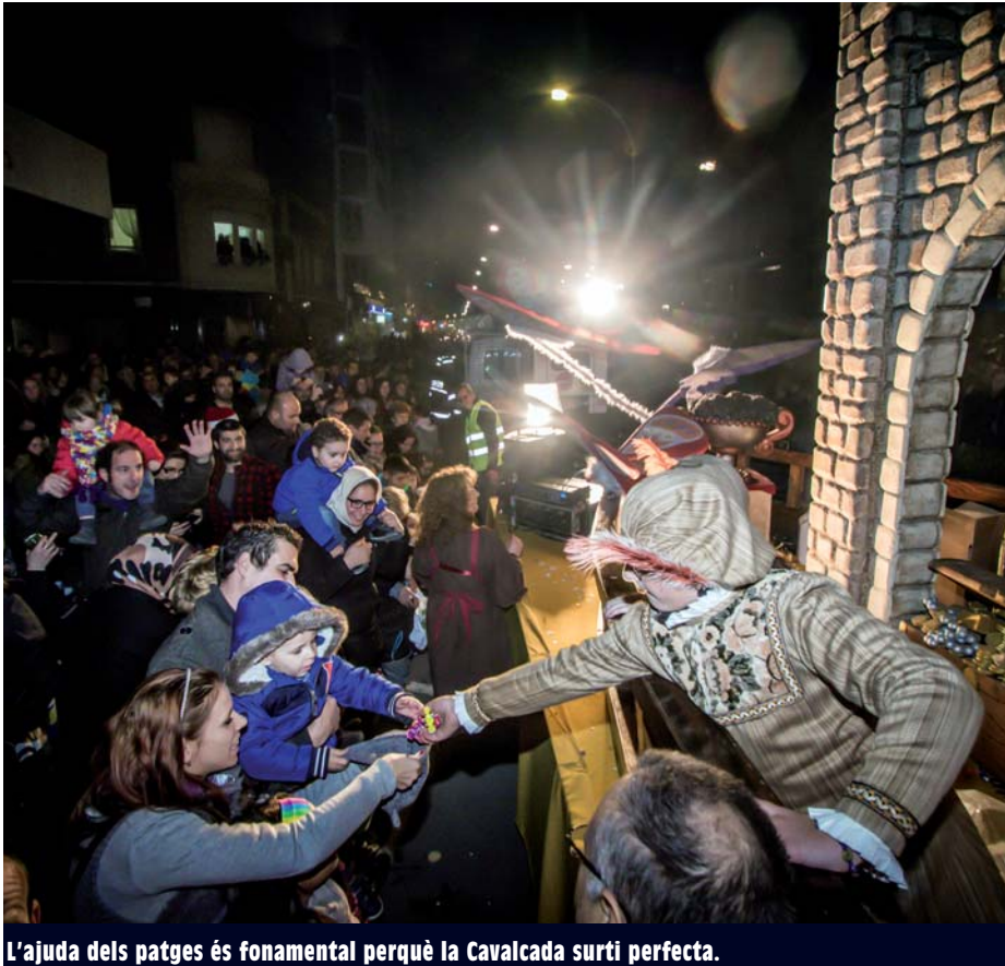
L'ajuda dels patges és fonamental perquè la Cavalcada surti perfecta.