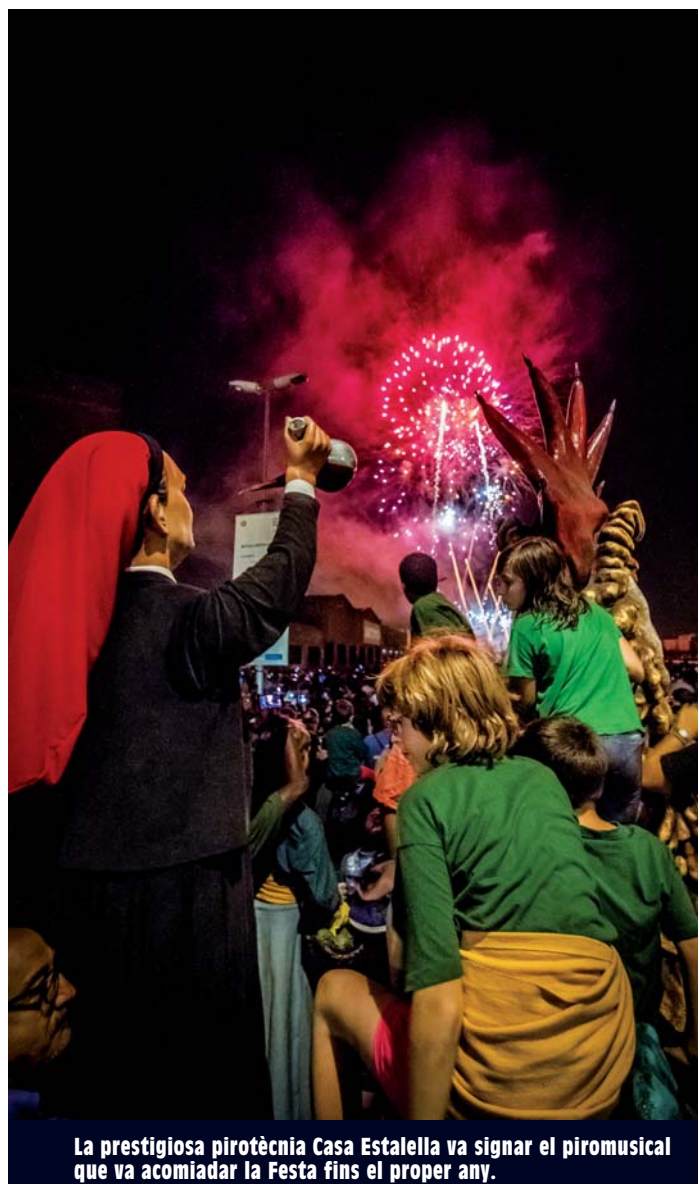
La prestigiosa pirotècnia Casa Estalella va signar el piromusical que va acomiadar la Festa fins el proper any.