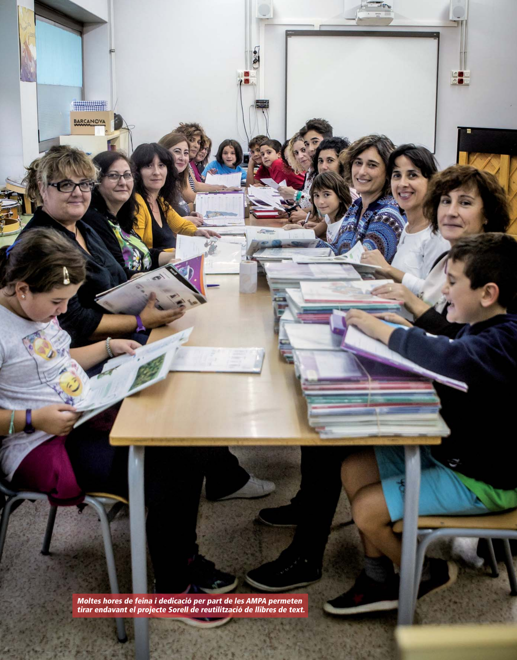
Moltes hores de feina i dedicació per part de les AMPA permeten tirar endavant el projecte Sorell de reutilització de llibres de text.