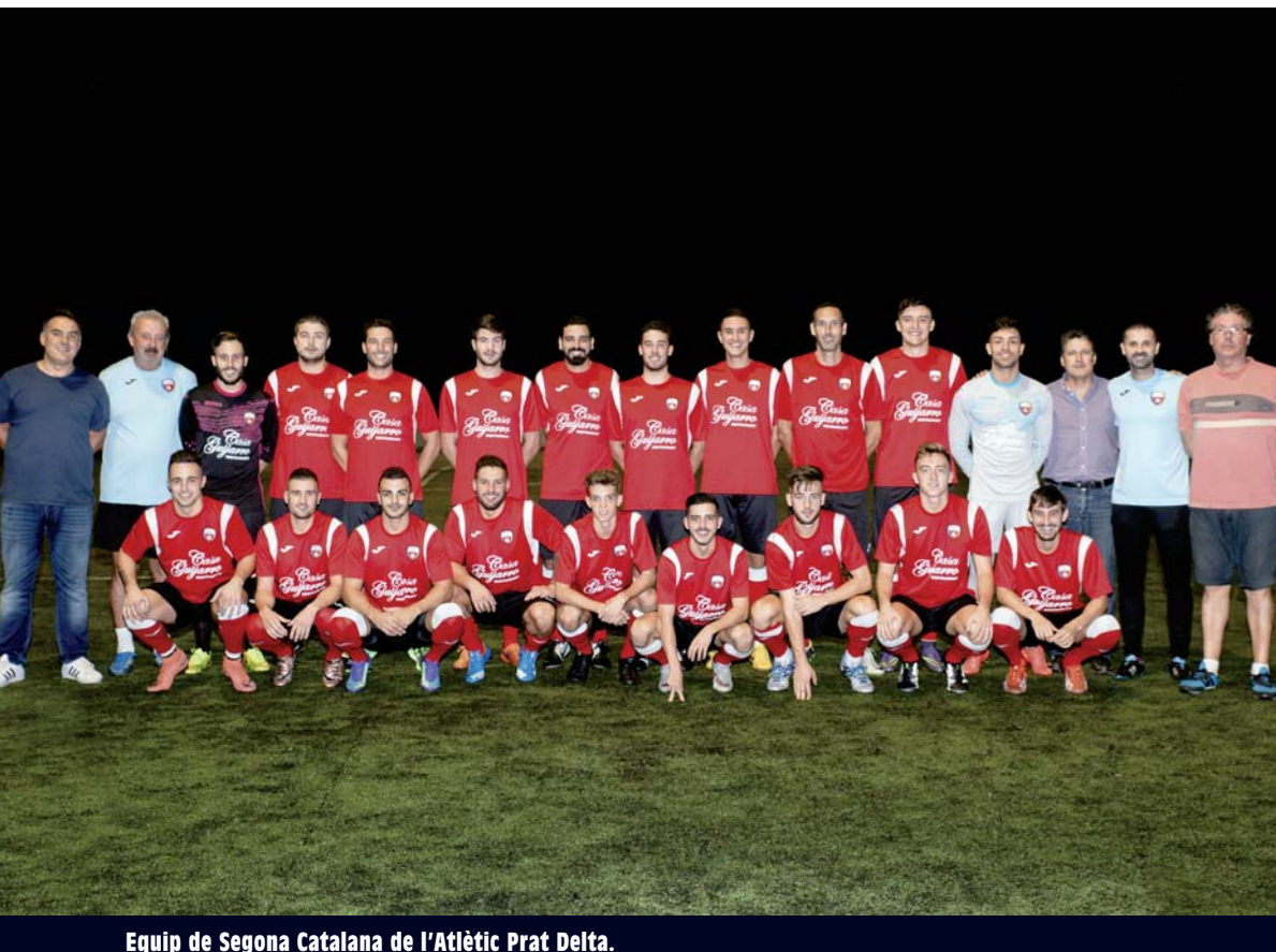
Equip de Segona Catalana de l'Atlètic Prat Delta.

De la fusió entre dos clubs, l'Atlètic Prat i el Delta Prat, ha nascut l'Atlètic Prat Delta, l'entitat que uneix el futbol que es juga al complex esportiu Julio Méndez