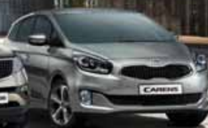
KIA CARENS desde 13.990€