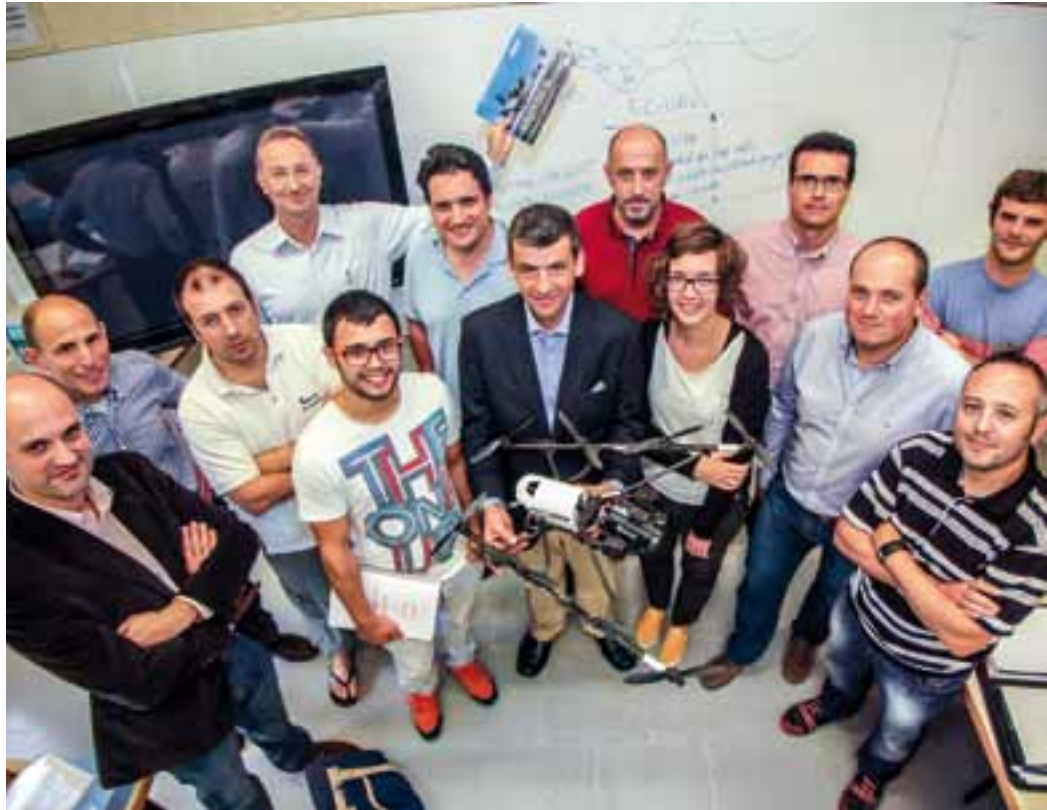
Persones participants en el curs de pilots de drones , amb un dels aparells.

Recentment, s'ha impartit al Centre de Promoció Econòmica de l'Ajuntament el curs bàsic i avançat de pilots de RPAS (Remoted Pilot Aircrafts Systems), petits avions no tripulats coneguts com a drones . Dotze alumnes han obtingut la certificació inicial requerida legalment per l'Agència Estatal de Seguretat Aèria per poder pilotar aquestes aeronaus.