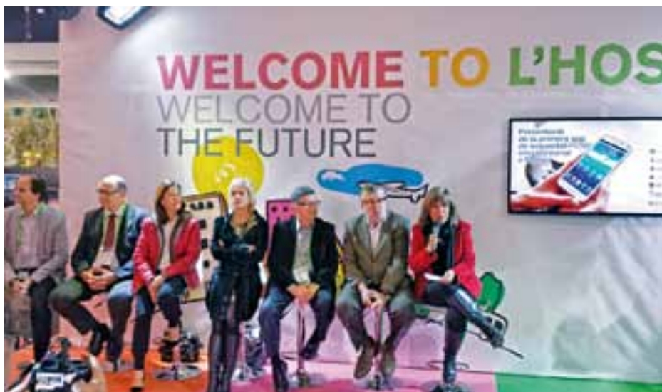
La presentació es va fer al recinte firal Granvia de l'Hospitalet, dins el marc de la fira Smart City Expo, amb la presència dels 7 alcaldes i alcaldesses.