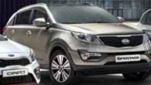
KIA SPORTAGE desde 15.200€