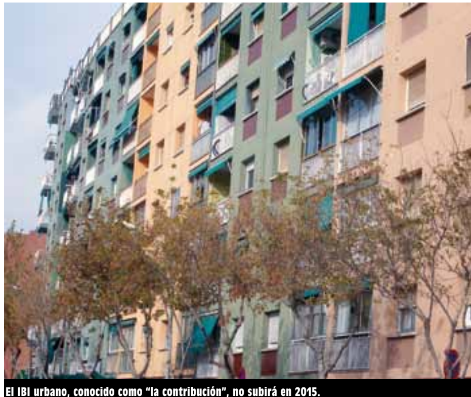
El IBI urbano, conocido como "la contribución", no subirá en 2015.

Para 2015 se mantendrán los tipos impositivos y las tarifas municipales que han estado vigentes en 2014, salvo el IBI del puerto y aeropuerto, que subirá un 1%