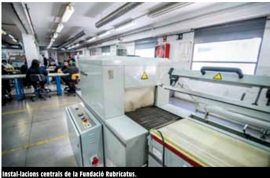
Instal·lacions centrals de la Fundació Rubricatus.

CONSUM MÉS EFICIENT A més de consumir energia renovable, la Fundació Rubricatus ha fet una auditoria energètica de totes les seves instal·lacions