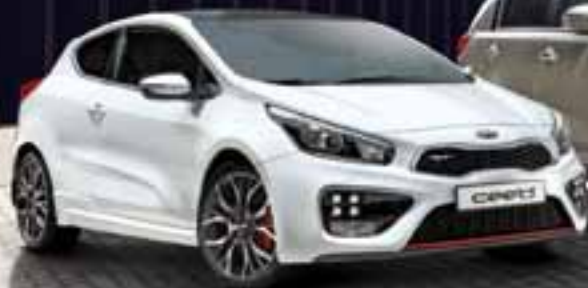
GAMA KIA CEE'D desde 10.990€

MANTENEMOS EL PLAN PIVE en toda la gama Kia