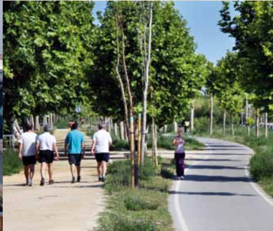
A la izquierda, aspecto que tenían antes el río, la playa y el acceso al litoral. A la derecha, aspecto actual.