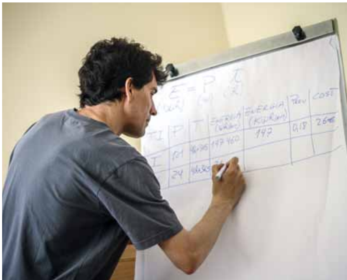
Un técnico explica, durante una sesión informativa, cómo ahorrar electricidad. Para más información, dirigirse al Punt Solidari.

Estas sesiones informativas están dirigidas a todas las personas que acuden a los Servicios Sociales y que están en