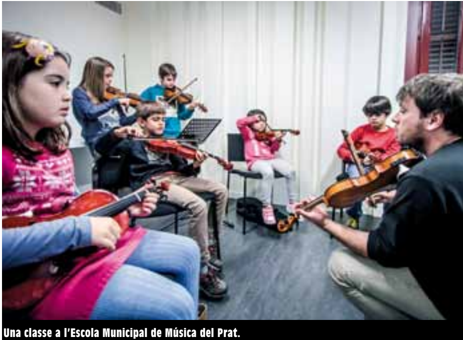
Una classe a l'Escola Municipal de Música del Prat.