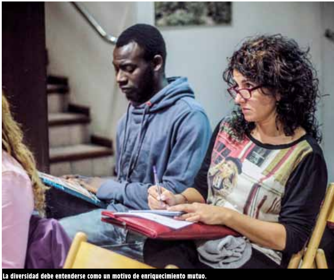
La diversidad debe entenderse como un motivo de enriquecimiento mutuo.

El Plan hace hincapié en la participación