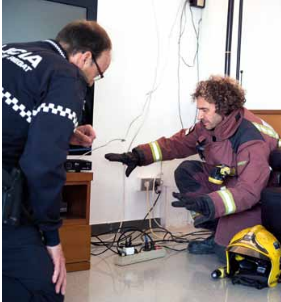
Los bomberos y la Policía Local de El Prat colaboran en la prevención de incendios.

Si huele a gas, no accionar ningún interruptor (luz, extractor, timbre...) y abrir todas las ventanas. Cerrar la llave del gas