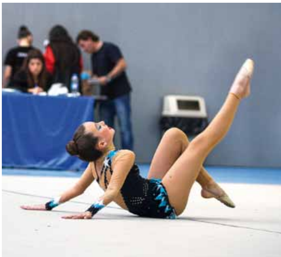
La rítmica pratenc a acumula èxits en els campionats des de fa anys.