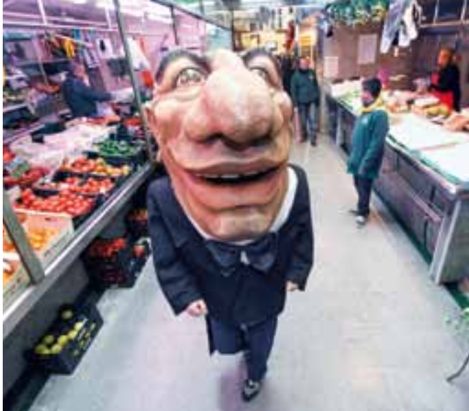
L'Home dels Nassos es passejarà per la ciutat el 31 de desembre.