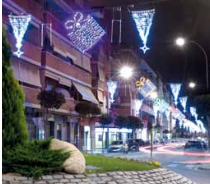
Il·luminació nadalenca d'un carrer comercial de la ciutat.