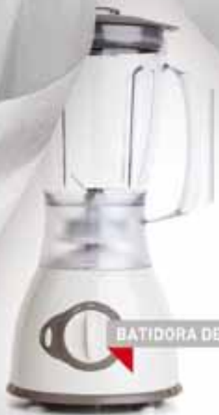
BATIDORA DE VASO