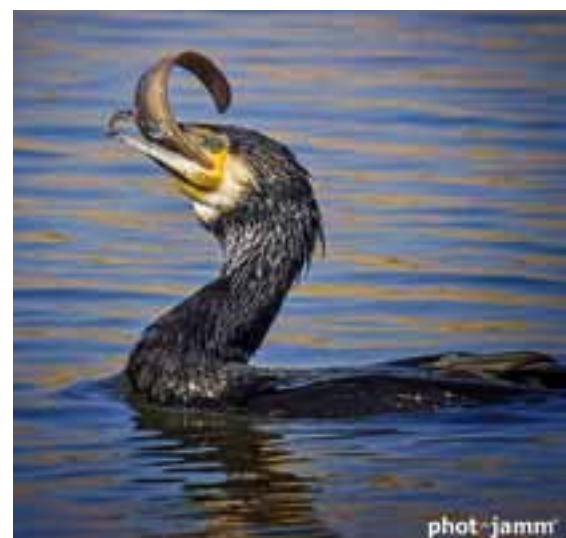
Premi Instagram: Corb marí, de José Antonio Maté.

NOTA: Per raons de maquetació, aquestes fotografies tenen un enquadrament i tractament diferents de les originals.