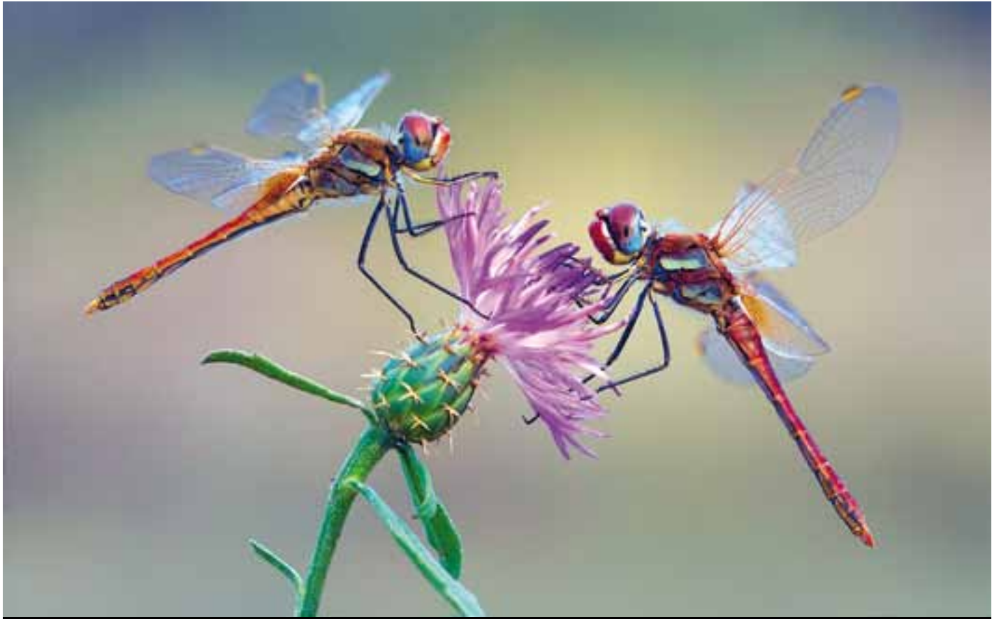
Primer premi Macrofotografia: Dúo de libélulas al amanecer , d'Alba Guapo Gallego.