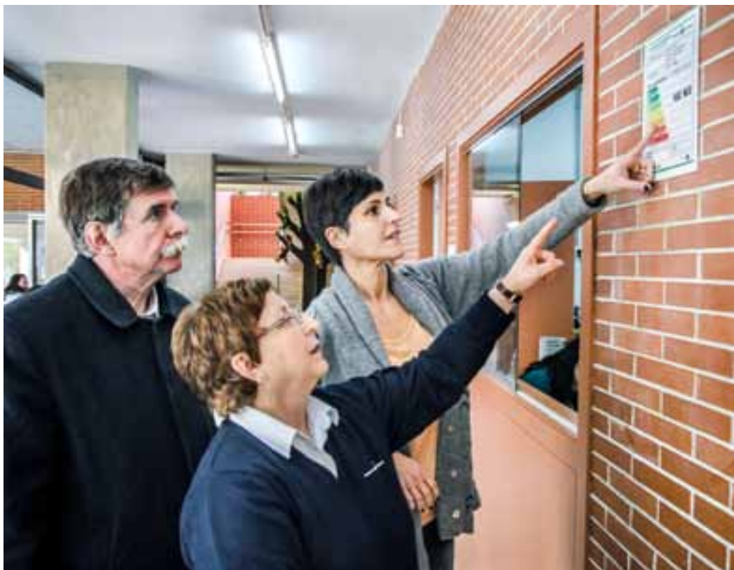
Els edificis municipals mostren les etiquetes d'eficiència energètica en lloc visible.

La certificació resulta d'estudiar l'estructura de l'edifici (orientació, tan-