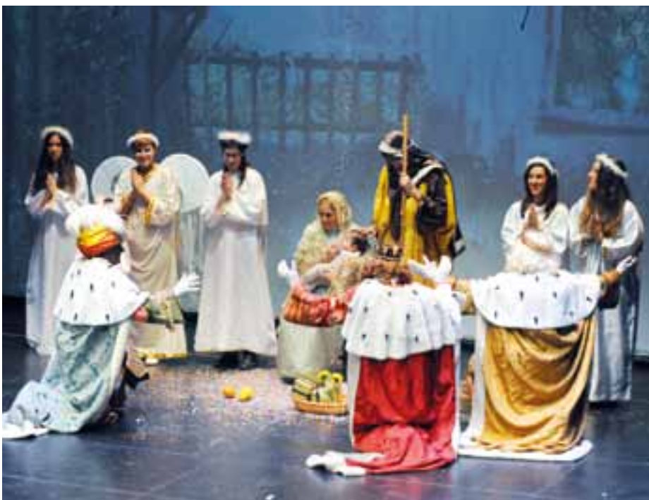
La Cia. Els Pastorets tornarà a fer una representació de l'obra Nit de Reis , al Teatre Modern.

Diverses entitats pratenques ens ofereixen espectacles musicals i teatrals amb motiu de les festes nadalencs