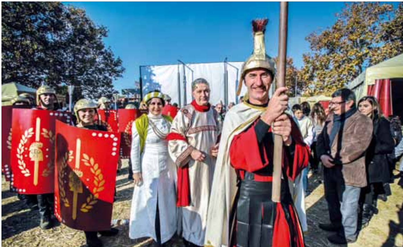
El Pessebre Vivent del Prat, organitzat per l'associació Amics de Sant Cosme, es va celebrar al parc Nou els dies 7 i 8 de desembre.

El cicle nadalenc de festes i tradicions torna al Prat un any més, amb les activitats de sempre, però amb algunes novetats que cal tenir en compte