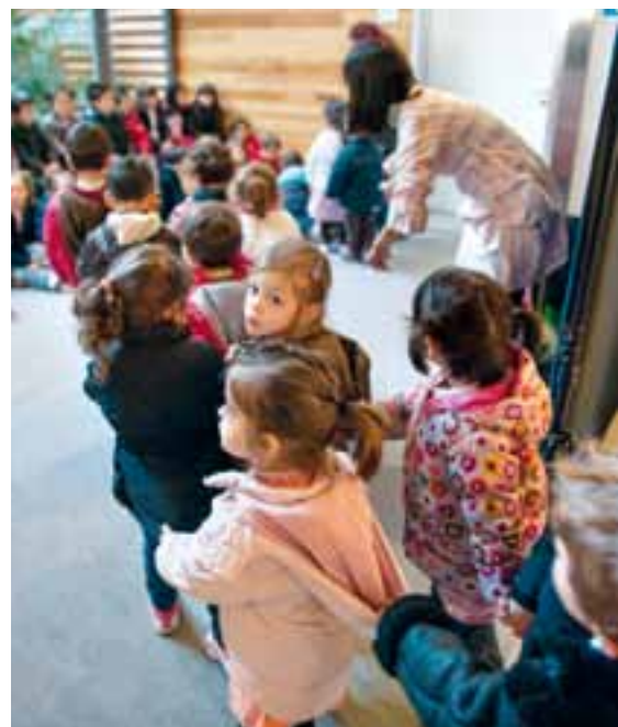
Escolars del Prat han visitat el pessebre de la pl. de la Vila i, a dins de l'ajuntament, se'ls ha explicat un conte nadalenc.