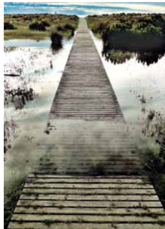
Menció especial: Paisatge núm. 2, de Quim Torrent.