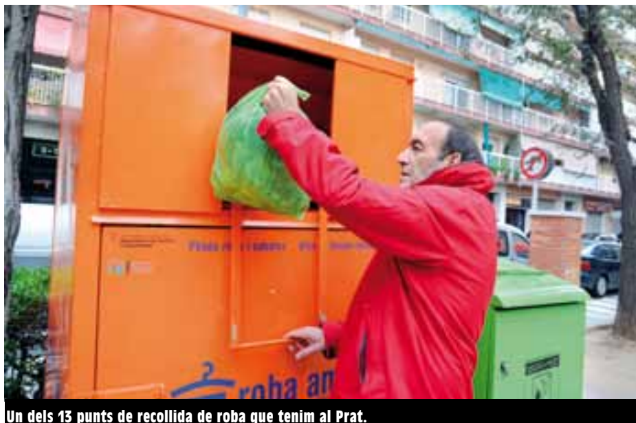
Un dels 13 punts de recollida de roba que tenim al Prat.

El peccat protagonista del Carnaval 2014 serà la gola, que farà de la ciutat una gran bacanal entre el 27 de febrer i el 5 de març. Trobareu tota la informació per demanar algun material municipal (plataforma o generador) o per inscriure's al concurs de comparses a http://carnaval.elprat.cat .