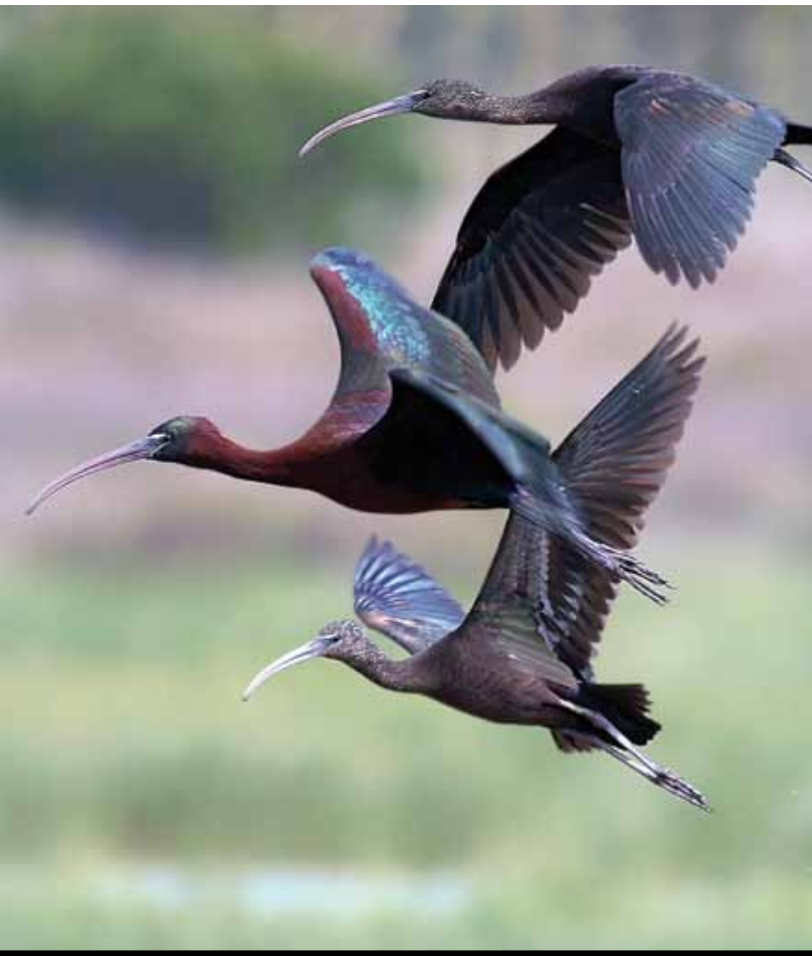
Primer premi Caça fotogràfica: Capó reial, de Francisco Valverde.