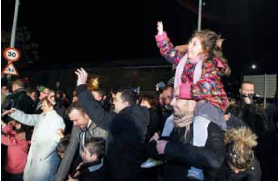
La Cavalcada és un dels esdeveniments nadalencs més esperats per les famílies amb infants petits.