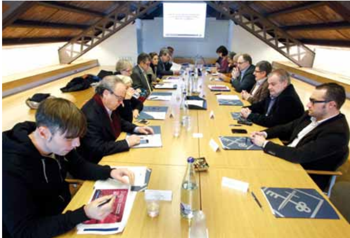
Reunión de la comisión de seguimiento del Pacto local para el empleo y la actividad económica de El Prat.

En el ámbito del empleo se darán ayudas a las empresas del municipio para la contratación de personas de El Prat en situación de desempleo. También se ayudará a las entidades pratenses sin ánimo