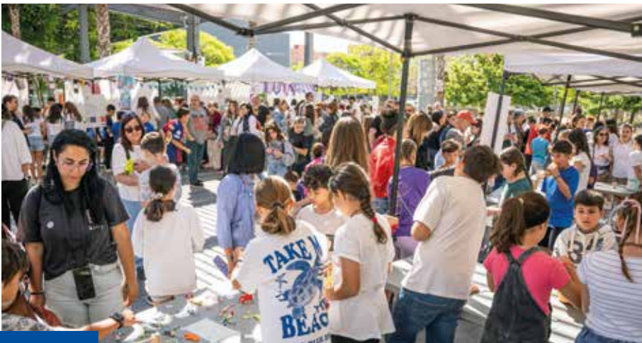
Mercat de les Cooperatives de l'any passat.

Serà a la pl. de Catalunya, en el marc dels actes del Maig Cooperatiu