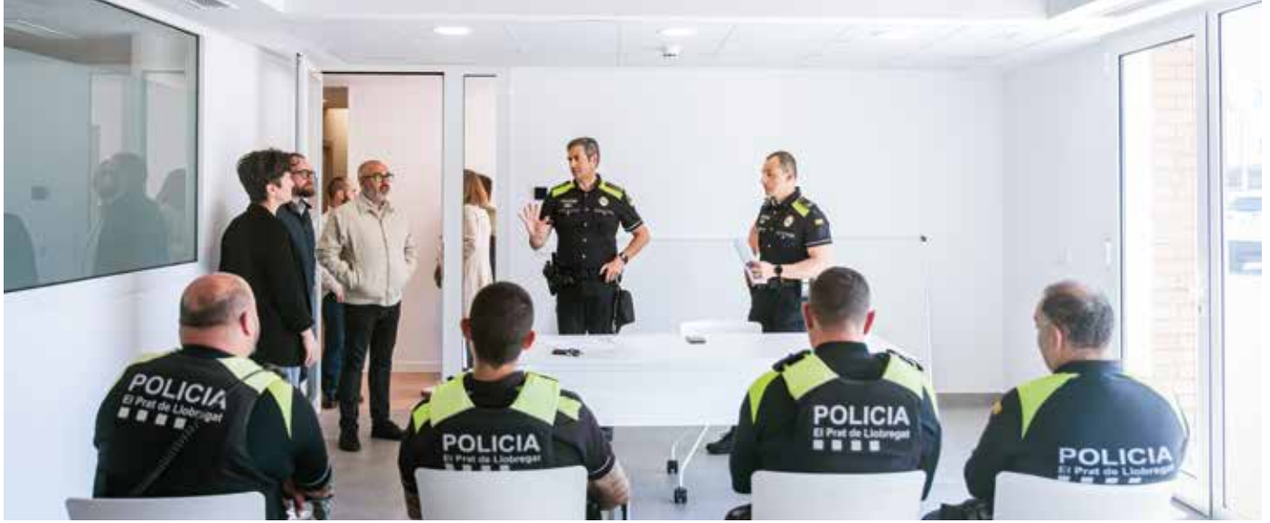
Nova sala de reunions de la prefectura.