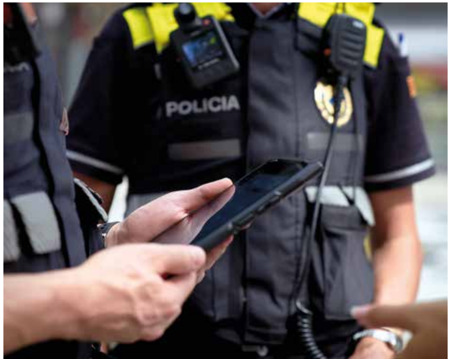
Un agent amb una de les noves tauletes electròniques que faciliten la tramitació de denúncies.

La prefectura de la Policia Local ha estat sotmesa a diverses obres de reforma que han permès millorar la tasca dels agents que hi treballen i també l'atenció a la ciutadania. Així, s'han ampliat i renovat els vestidors -tant els dos masculins com el femení-, la sala de reunions, la de coordinació d'emergències i les oficines de recepció de denúncies i d'atenció a les víctimes de violència de gènere, que ara respecten molt més la intimitat de les persones denunciants, entre altres reformes menors.