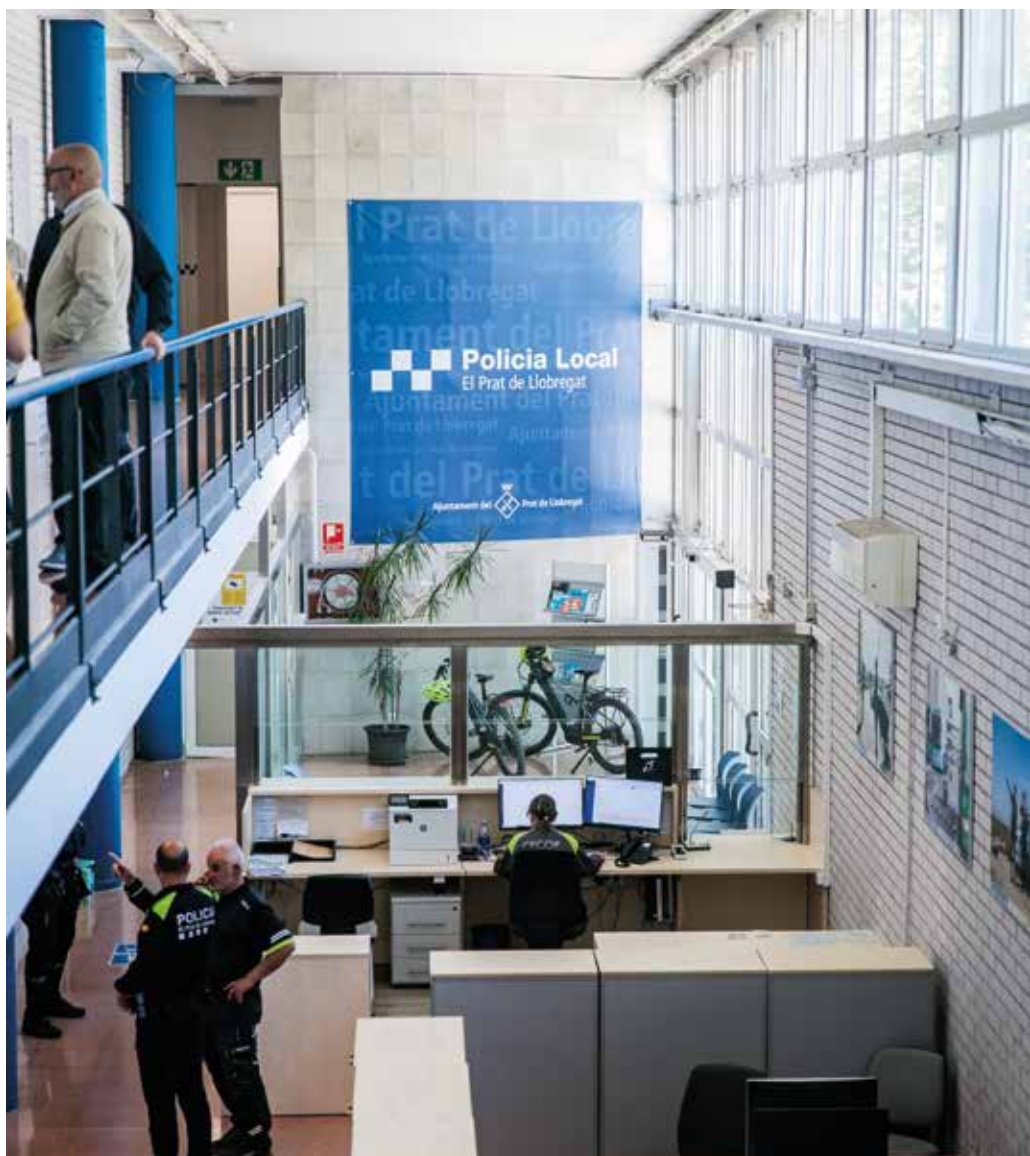
Vista general del vestíbul de la prefectura.

El Prat incorporarà properament 15 nous agents a la Policia Local, després d'un procés selectiu que ha despertat força interès entre la població, ja que més d'un centenar de persones han assistit a les tres sessions informatives organitzades. Les persones que superin les proves d'accés faran el curs bàsic de policia a l'Institut de Seguretat Pública de Catalunya (ISPC), de nou mesos de durada, i posteriorment faran un any de pràctiques a la Policia Local de la nostra ciutat, abans d'incorporar-s'hi plenament.