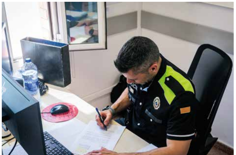
Nova oficina de recollida de denúncies.

Aquest any es renovarà part de la flota policial amb la incorporació de cinc cotxes patrulla elèctrics, sis motos també elèctriques, un cotxe de paisà i un tot terreny per a serveis especials.