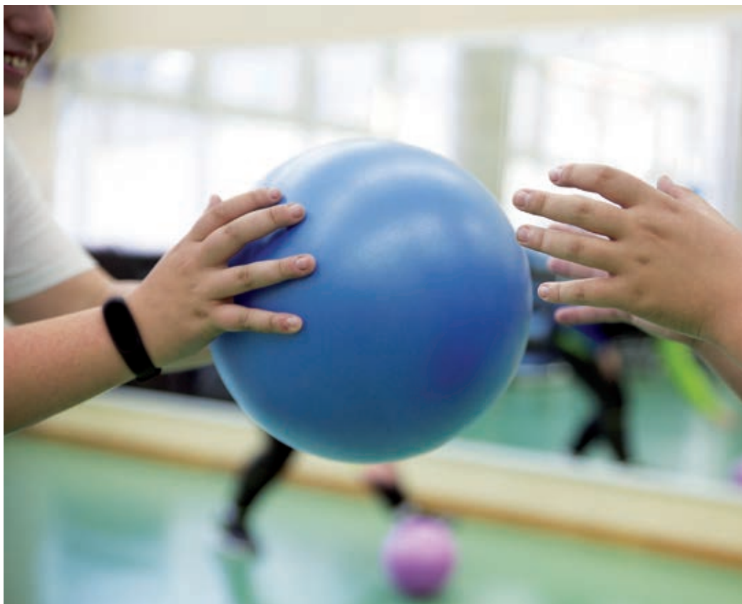
L'activitat física, juntament amb una alimentació adient, és fonamental en la lluita contra el sobrepès.

L'Ajuntament i els centres d'atenció primària posen en marxa el projecte "Infants actius", per introduir hàbits saludables entre els nens i les nenes amb excès de pes