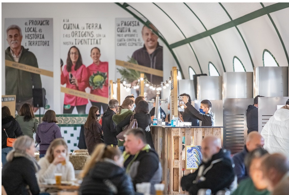
Espai Gastronòmic de la Fira Avícola de 2021

L'Espai Gastronòmic, organitzat per l'Ajuntament del Prat i l'Associació Gastronomia i Turisme (AGT) del Baix Llobregat, basarà la seva oferta en platets de pollastre Pota Blava i Carxofa Prat, a més d'oferir diversos menús per a les persones que visitin la Fira.