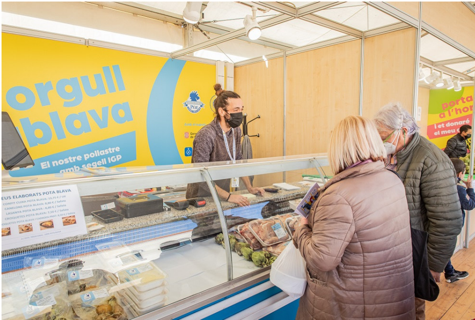
Parada de pollastre Pota Blava a la Fira Avícola del Prat de 2021

L'oferta comercial de la Fira Avícola d'enguany comptarà amb una àmplia gamma de productes i serveis i serà un excel·lent aparador i oportunitat de promoció del teixit comercial local i dels projectes emprenedors. S'hi trobarà un interessant sector especialitzat en alimentació tradicional d'origen, així com estands de comerços locals i d'arreu del país.