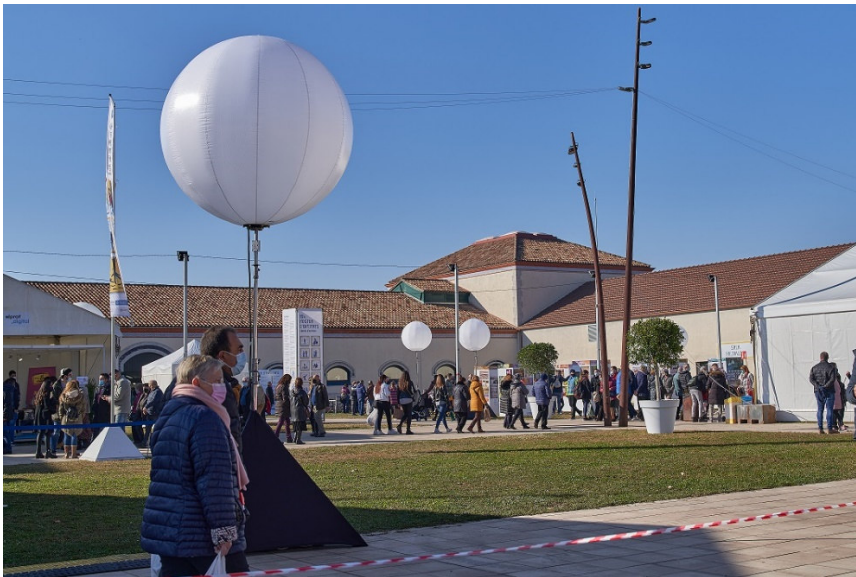
Imatge de la Fira Avícola 2021

La 49a Fira Avícola del Prat unirà enguany la millor gastronomia de proximitat amb la defensa de la sostenibilitat social i ambiental. La fira s'avança respecte a edicions anteriors i tindrà lloc del 2 al 4 de desembre a la Granja de la Ricarda, amb un recinte firal de 19.000 m 2 . S'hi podrà trobar una àmplia oferta gastronòmica i comercial, amb el pollastre Pota Blava com a protagonista, juntament amb d'altres productes de proximitat i de qualitat, com la Carxofa Prat. Tampoc no hi faltaran les propostes culturals i lúdiques.