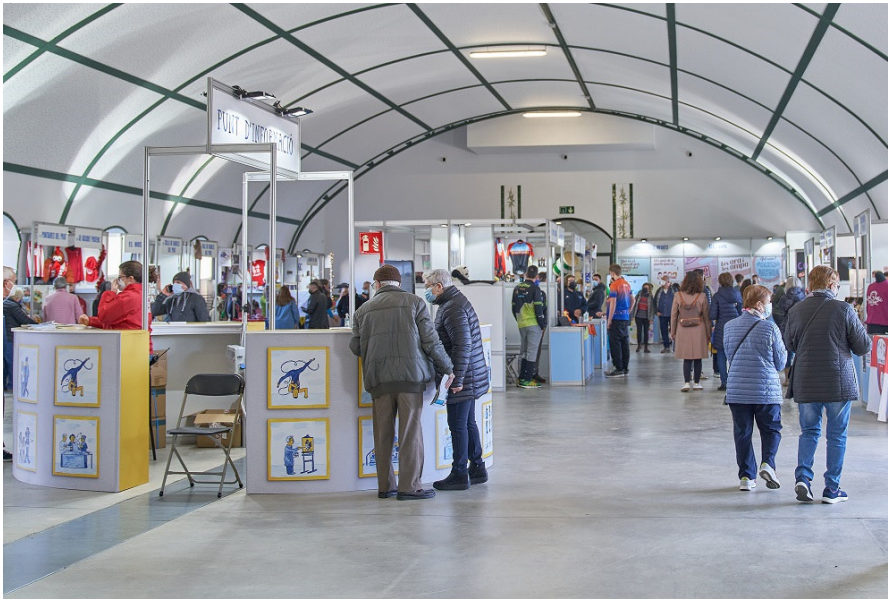
Foto de la Mostra d'Entitats durant la Fira Avícola 2021

La 20a Mostra d'Entitats tindrà lloc en el marc de la Fira Avícola, del 2 al 4 de desembre a la Granja de la Ricarda. L'esdeveniment vol donar a conèixer als pratencs i les pratencques la tasca que fan les diferents entitats i associacions de la ciutat.