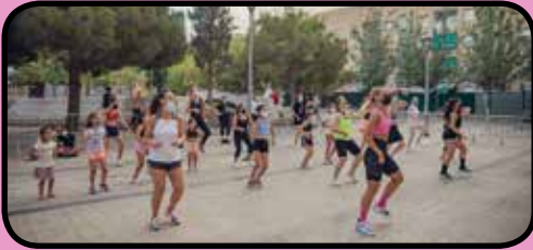
Estiu a la plaça!