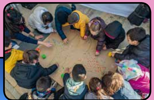
Alumnes del barri als tallers del Fem nadal