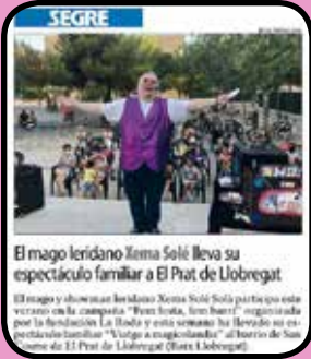
Espectacle de màgia al barri!