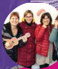
Artesanes de Prat Crea