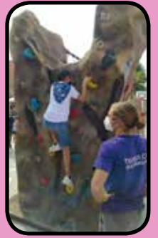
Festival de la Diversió al Jaume Balmes