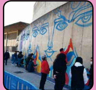
Pintada de mural comunitari amb motiu del 25N