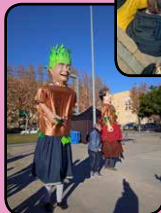
Gegants de l'INS Escola ballant al Fem Nadal