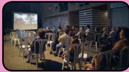
Cinema a la fresca