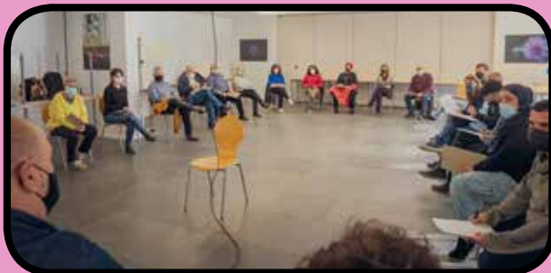
Taula comunitaria de Sant Cosme