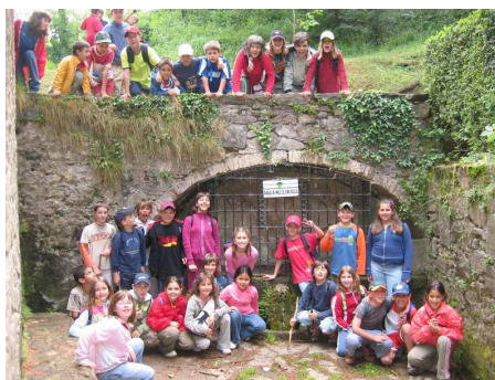
ESC Segimon Comas (sant Quirze Besora)

Integrar-ho millor d'una manera més transversal a diferents àrees i nivells. Aconseguir que l'espai web on es reponeix tota la informació sigui més acurada i actualitzada. Manca de recursos humans i econòmics per a fer-ho.