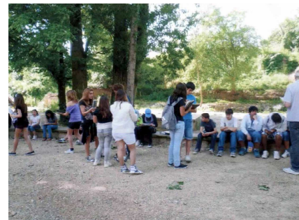
ESC Narcís Oller (Valls)

Fomentar el coneixement i el treball comú, la recerca i l'actuació en el propi entorn Descobrir les fonts, l'aigua i el valor social de l'entorn com a recurs educatiu i espais d'aprenentatge. Participar en l'inventari d'aquest be patrimonial comú.