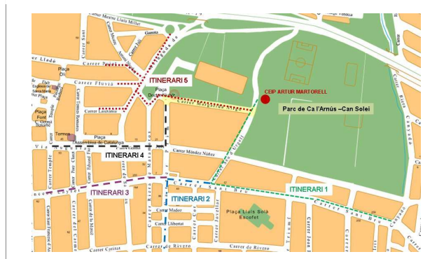
Plànol dels itineraris principals pels que anem a l'escola (Badalona)

S'ha dissenyat tota la proposta i activitat amb els pares i mares compartint Objectius, metodologia i desenvolupament. Amb l'ajuntament en la primera fase per la diagnosi i identificació per a fer propostes de millora a la via pública. S'han assolit els objectius plantejats, solucionant l'estacionament de vehicles davant del centre i s'ha millorat substancialment la mobilitat.