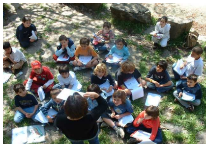
ESC Fortià Solà (Torelló)