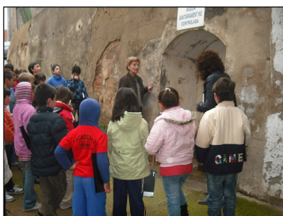
ESC Bernardí Tolrà (Vila-rudana)