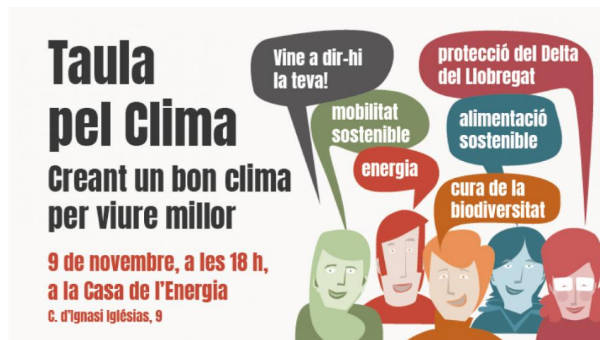
Figura 1.1. Imatge gràfica de la primera sessió de la Taula pel Clima.

El 9 de novembre de 2022 ha tingut lloc la primera sessió ciutadana de la Taula pel Clima , que ha estat dedicada al vector Energia.