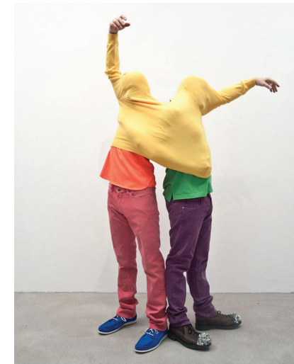
Erwin Wurm One Minute Sculptures, 2003

Com fa el propi Erwin Wurm, fotografieu/graveu en vídeo el resultat de l'escultura vivent i afegiu la documentació gràfica a la capsa-viatgera o envieu-la per mail a unzip@elprat.cat