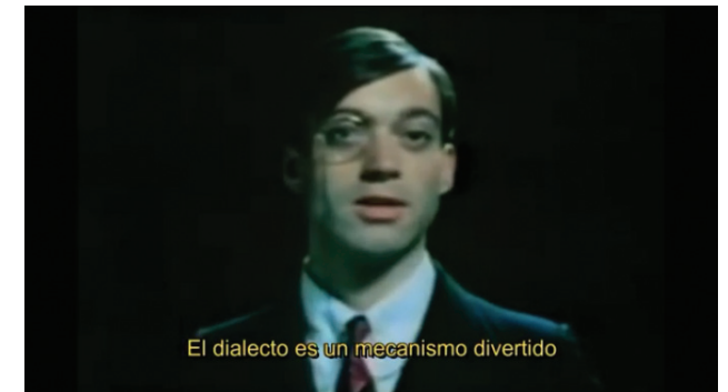
Tristan Tzara sobre Dadà - Extracte del documental "Europe after the rain".