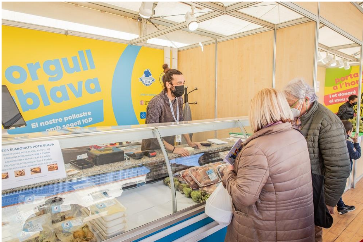
Parada de pollastre Pota Blava a la 48a Fira Avícola

Després de l'èxit dels anys anteriors, s'instal·larà per tercera vegada a la Fira el pavelló del Prat Economia. A l'entrada del pavelló hi trobareu el Passeig del Comerç, un aparador de les botigues i establiments de la ciutat. A l'interior hi veureu una representació del teixit empresarial pratenc, representat en l'entitat el Prat Empresarial. Enguany, aquest espai estarà centrat en la promoció de les vocacions industrials i STEM (sigles que, traduïdes de l'anglès, signifiquen "ciència, tecnologia, enginyeria i matemàtiques") i acollirà una taula rodona amb empreses per donar a conèixer la feina i el valor de les professions científiques, tecnològiques i industrials al territori. També se celebraran dos tallers de robòtica i programació oberts a la ciutadania, a fi d'estimular i desenvolupar talent en aquests sectors. Finalment, el Prat Empresarial i el Gremi de Restauradors del Prat organitzaran dues taules rodones de temàtica gastronòmica.