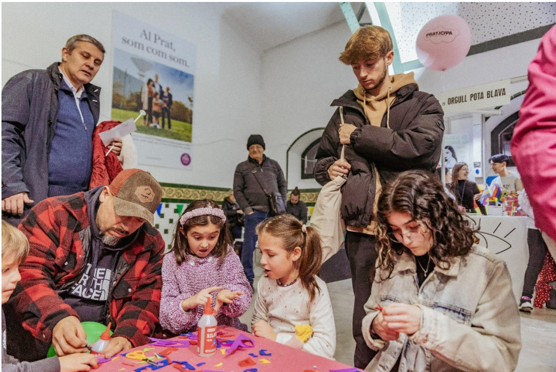
Famílies participen al Praticipa de la mostra d'entitats, a la 49a Fira Avícola

En aquesta ocasió, la Mostra reuneix gairebé un centenar d'entitats de diferents àmbits: social, educatiu, esportiu i cultural, així com consells municipals i projectes municipals. Les entitats també celebraran les 50 edicions de la Fira mirant al passat i la seva història, de vital importància per a la ciutat del Prat, gaudint el present i somiant un futur amb nous reptes i fites.