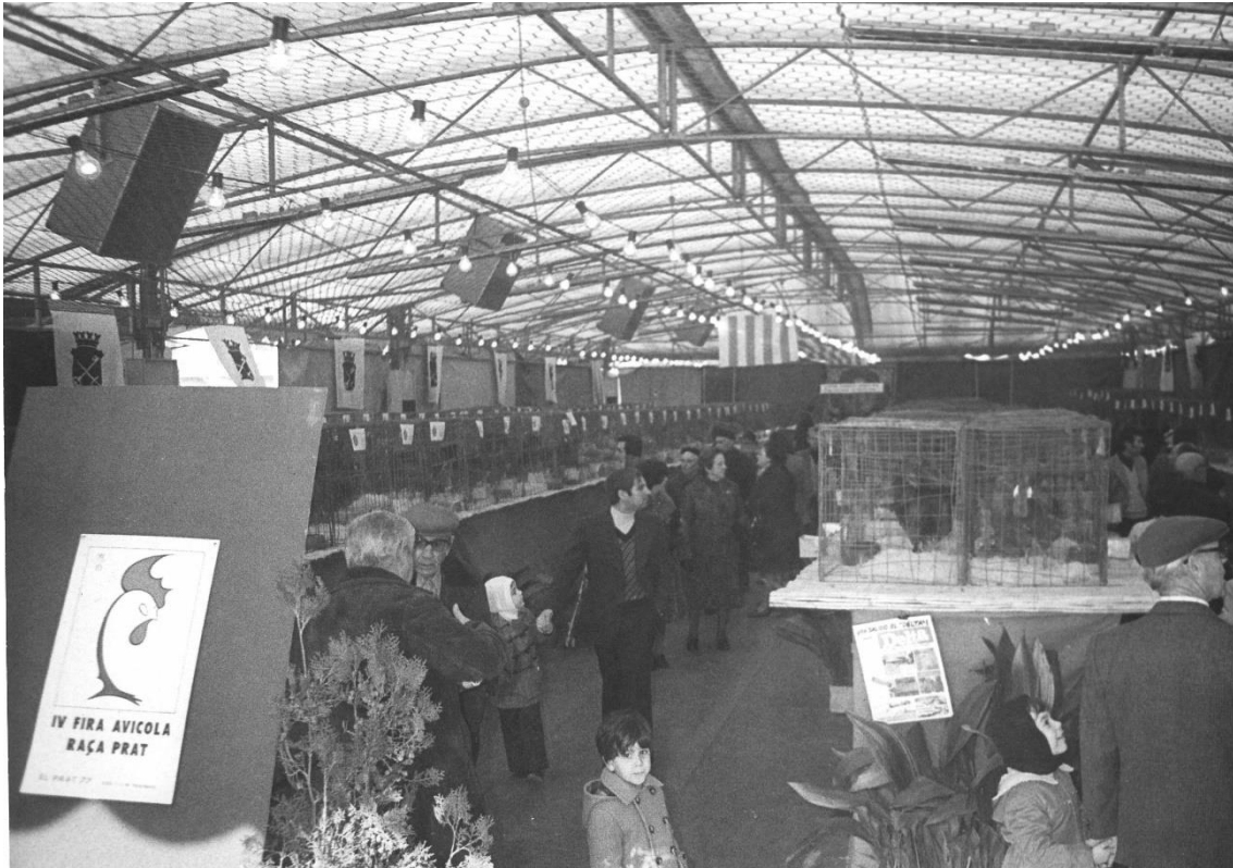
La 4a Fira Avícola, el 1977, va ser una de les que es van celebrar aprofitant uns autos de xoc com a carpa.

Amb motiu d'aquestes 50 edicions de la Fira, a més a més, l'Associació Gastronomia i Turisme (AGT) ha preparat, amb la col·laboració de l'Ajuntament, un documental que recull la història de la fira a través de les veus de moltes persones que han contribuït a la seva història. Aquest documental es presentarà dissabte a la tarda a la fira i es podrà veure a l'estand municipal.