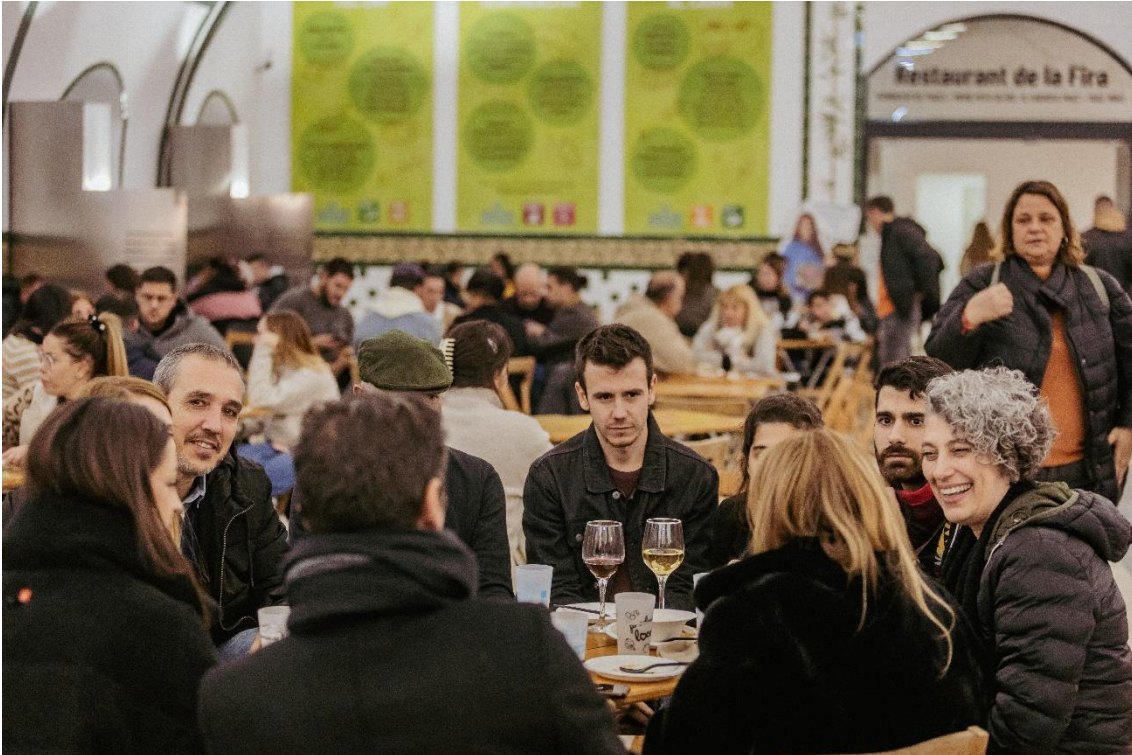
Espai gastronòmic a la 49a Fira Avícola

La Fira Avícola no s'entén sense la gastronomia del nostre territori. L'Espai Gastronòmic, organitzat per l'Ajuntament del Prat i Associació Gastronomia i Turisme (AGT), oferirà un any més una oferta gastronòmica que aposta per la sostenibilitat, basada en platerets de pota blava, carxofa Prat i producte de temporada del Parc Agrari del Baix Llobregat.