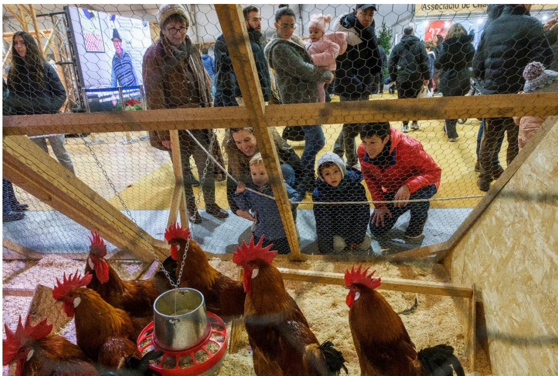
Imatge de la Fira Avícola 2022

Si la Fira Avícola de la Raça Prat sempre és especial, enguany ho és per partida doble, ja que arriba a la màgica xifra de 50 edicions. Tot just el primer cap de setmana de desembre, un mes farcit de fires a Catalunya, torna una de les que s'ha convertit ja en un imprescindible al calendari. Se celebrarà de nou a la Granja de la Ricarda, tot just una setmana i mitja després que aquest espai hagi saltat a la fama mundial en esdevenir l'escenari del videoclip que Björk ha realitzat amb Rosalia i que ha dirigit la creadora catalana Carlota Guerrero.