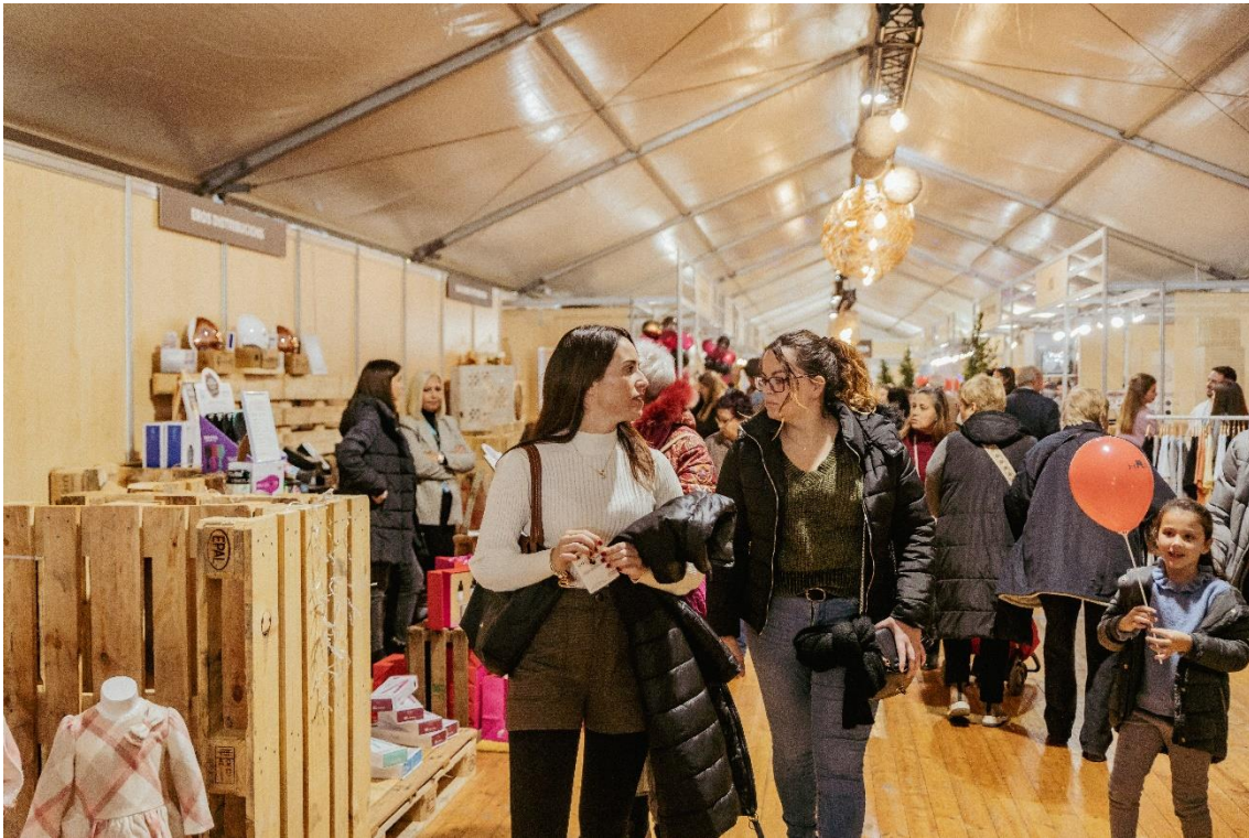
Passeig del comerç a la 49a Fira Avícola