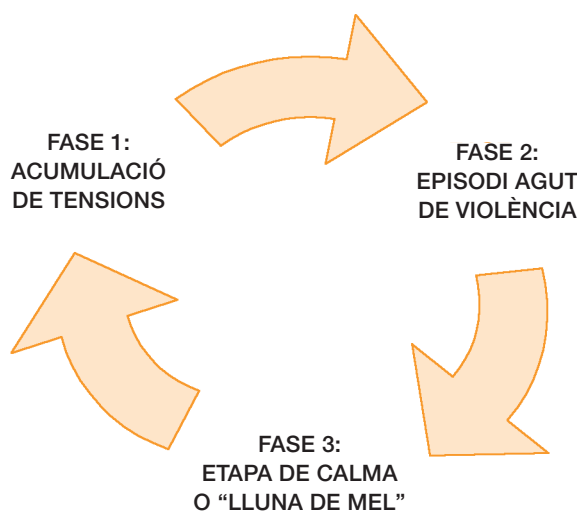
Figura 1. Cicle de la violència

Font: Walker L. The battered woman syndrome. Nova York: Springer; 1984.