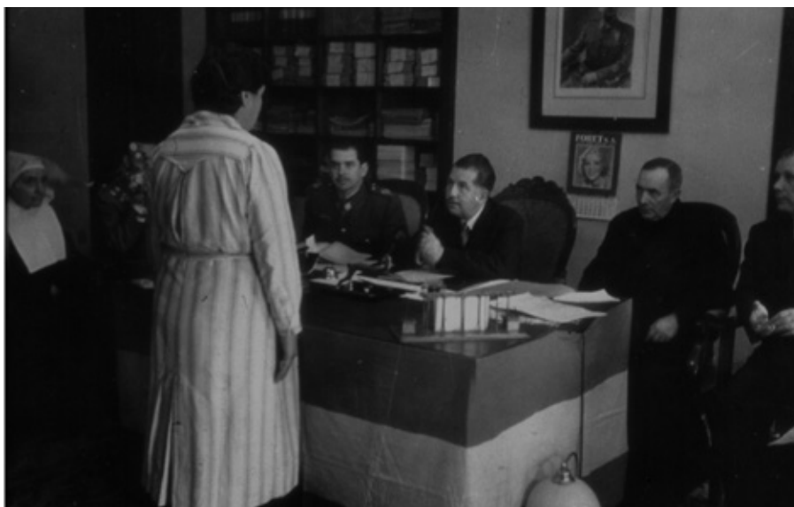
■ El tribunal de revisió de condemnes comunica a una presa de les corts el seu indult, el 9 d'abril de 1944