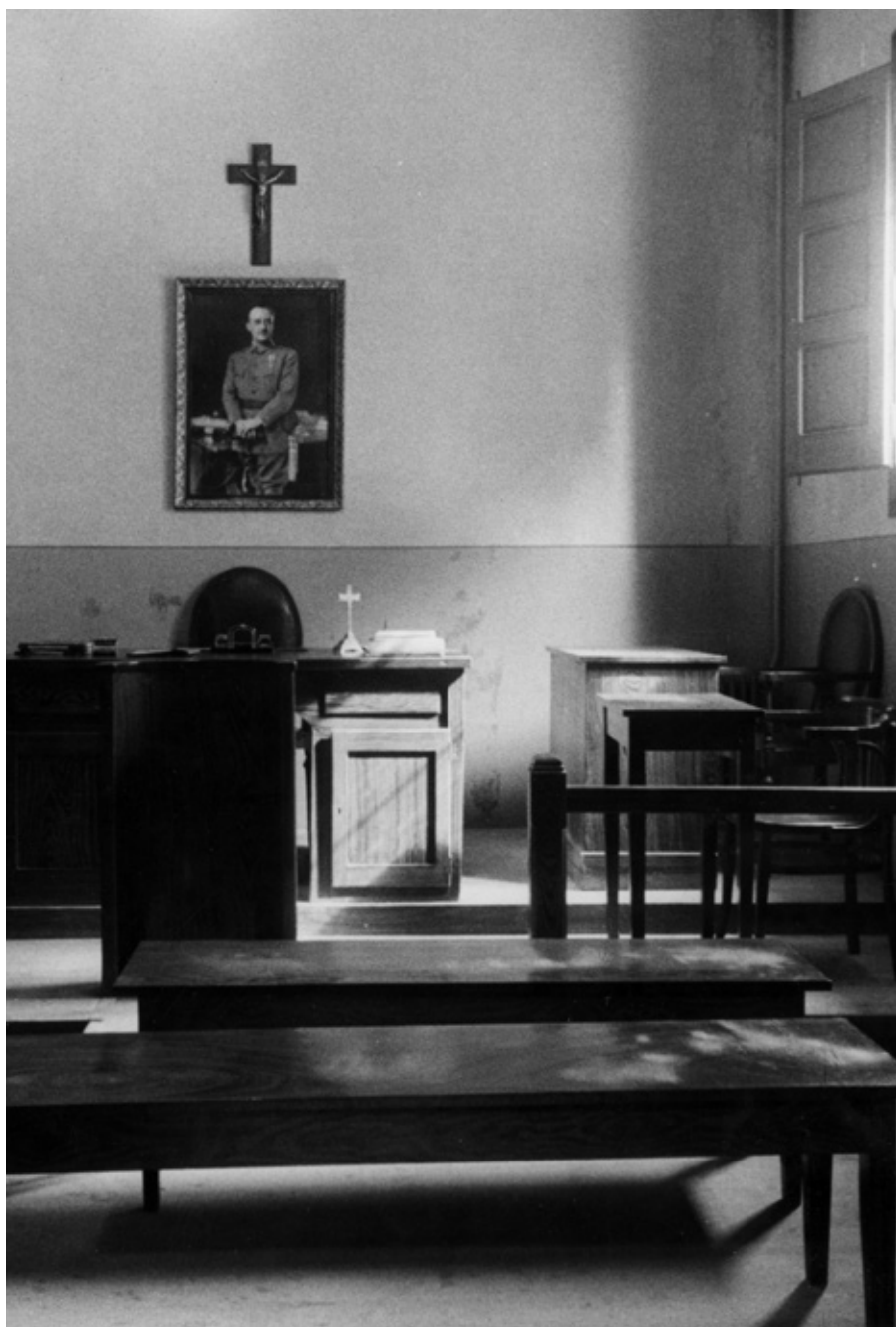
■ Sala d'audiències del jutjat, any 1948