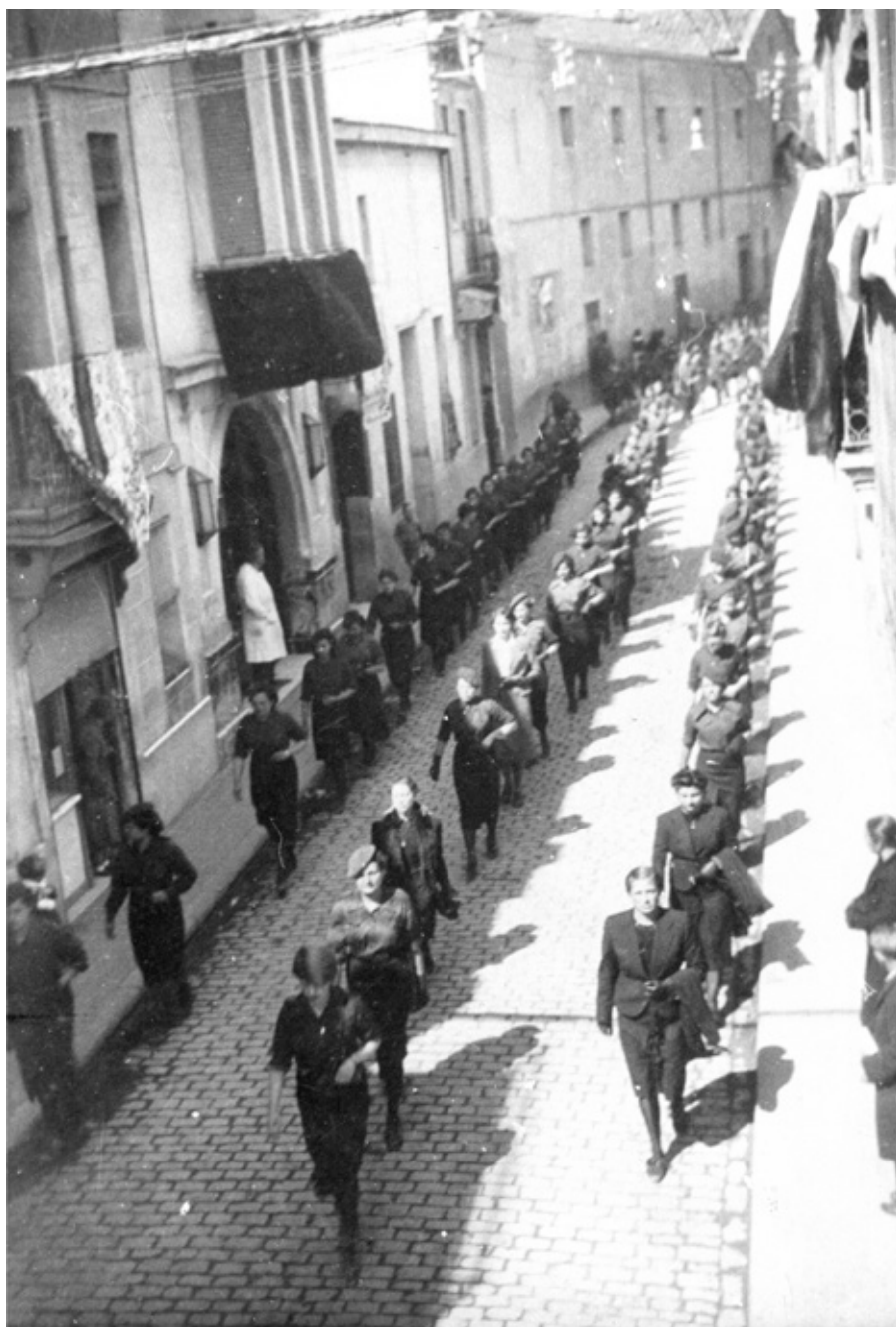
■ Dones falangistes desfilant pel carrer de Ferran Puig