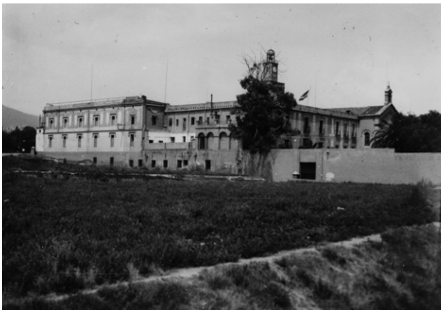
■ Vista general de la presó de les corts, situada a l'antiga masia medieval anomenada Can Duran