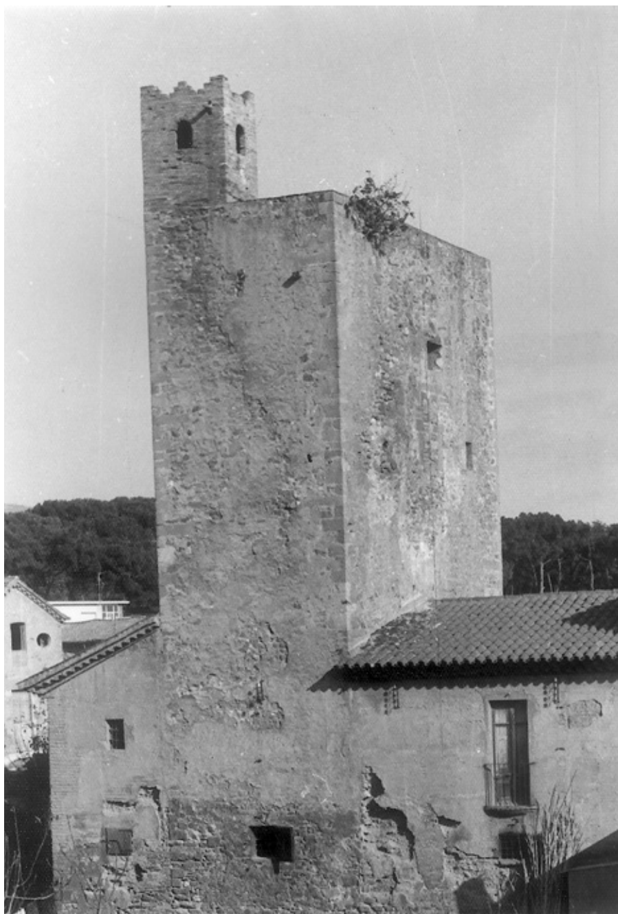
■ Exterior de la presó de Sant Feliu