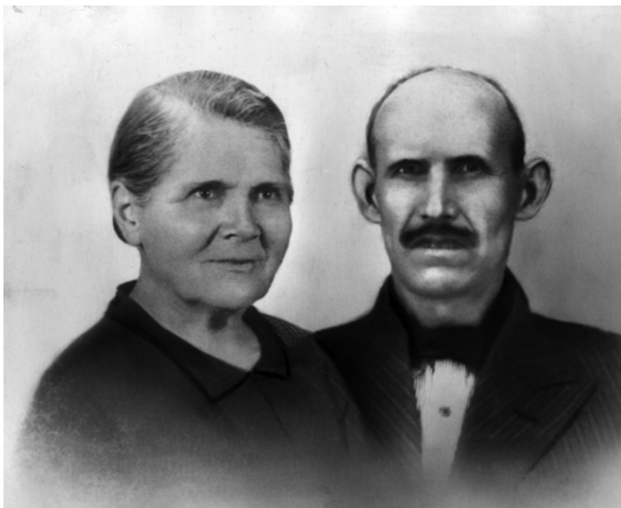
■ Matrimoni Cortés

Després de tantes peripècies, van poder tornar al Prat. El seu calvari, però, encara no havia acabat. Es van trobar que els havien pres la casa que tenien a la Rambla i que no quedava res dels objectes i records que hi tenien. Quan ells van haver de marxar ho havien deixat tot embolicat i ben desat, i quan van tornar no quedava res. Ningú no els va donar raons del que havia passat, però ells mateixos van poder veure algunes de les seves pertinences a les cases dels veïns.