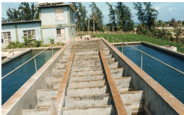
Planta d' aigua a Gibara (Cuba)