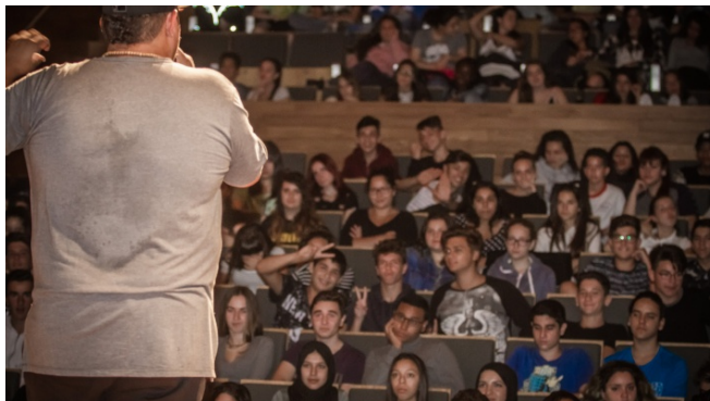
Jornades del projecte de Ciutats Defensores dels Drets Humans

Es treballarà també la connexió amb les activitats no formals liderades per les entitats locals i l'ajuntament.