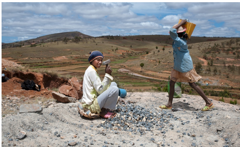
Projecte de l'ONG Yamuna a Madagascar.

Importants han estat també les iniciatives que ha dut la cooperació impulsada des de la societat civil pratenca a més de quinze països i en nombroses situacions d'emergència. Només en el període 2012-2016 s'han invertit al voltant de vuit-cents mil euros, malgrat l'escenari de crisi econòmica, havent-se mantingut un nivell d'inversió que sense dubte caldrà incrementar a mig termini per equipar-ho al compromís polític i solidari del municipi.