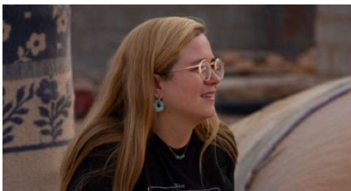
La participant, en un moment de l'estada als campaments

Totalment. Per conèixer, cal ser-hi, conèixer i veure la realitat de les hores eternes sota un sol cremant així com les nits fredes del desert. Cal fer lligams, parlar, riure i compartir moments. Per la part mèdica, et connecta amb l'essència de la medicina: escoltar, cuidar i adaptar-te a l'altre amb empatia.