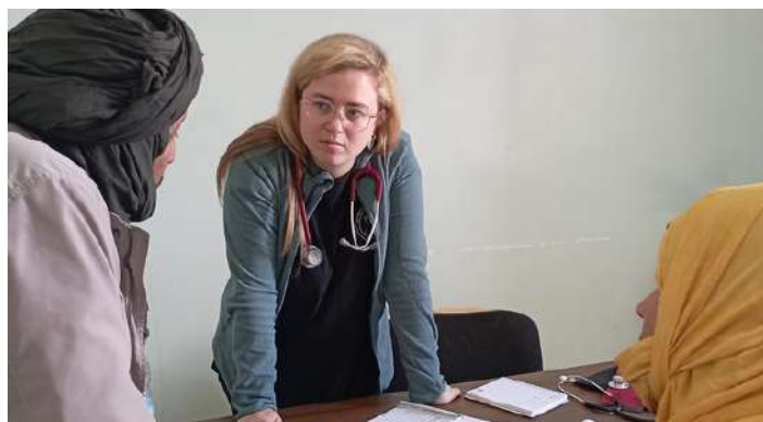
L'Ariadna passant consulta a l'hospital de Bojador

El repte més gran que vaig trobar va ser adaptar els coneixements mèdics adquirits en el nostre entorn a una realitat marcada per la manca de recursos. Allà no disposen de proves complementàries ni accés a medicines que aquí són primera línia de tractament. També va ser impactant el fet de veure com la gran